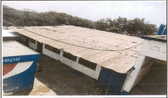
Foto 12: LA ESTRUCTURA METALICA Y LA LAMINA SE ENCUENTRAN EN MAL ESTADO POR LO CUAL SE CAMBIARÁ

_____ Firma y sello del Presidente de la OPF