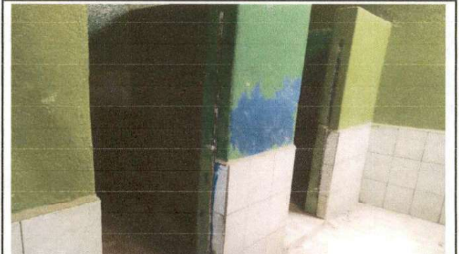
Foto 8: SE QUITARA EL AZULEJO EXISTENTE PARA RESANAR PAREDES Y UNIFICAR CON EL NUEVO AZULEJO