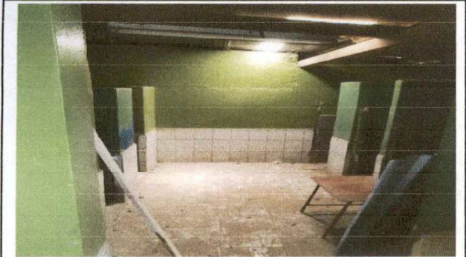
Foto 7: EL ESTADO DE LA BATERIA DE BAÑOS ACTUALMENTE ESTA DAÑADA POR LO QUE SE NECESITA REMOZAMIENTO TOTAL DEL ÁREA