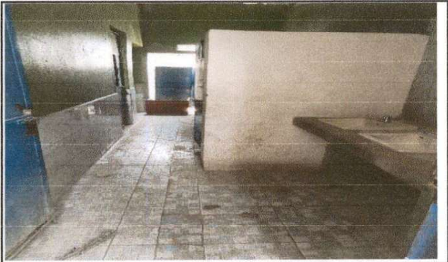
Foto 11: EL PISO ESTA DETERIORADO POR LO QUE SE COLOCARA PISO DE GRANITO