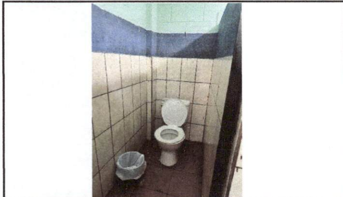
Foto 1: . Actualmente debido a la falta de suministro de agua de manera directa a los inodoros, presentan problemas de bloqueo al momento de realizar la descarga.