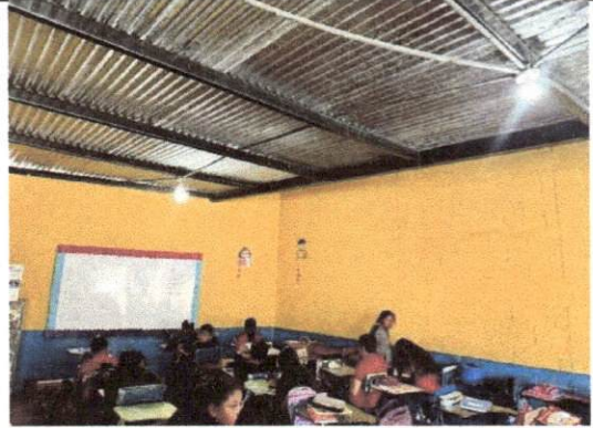
Foto 8: Debido a la cantidad de niños, la falta de ventilación natural y las condiciones climáticas del lugar las temperaturas son elevadas dentro de los salones de clases.