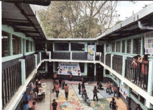
Foto 9: Durante la época de lluvia este espacio queda sin poder ser utilizado y permite que el agua ingrese en las aulas inferiores y en los pasillos de segundo nivel, afectando el desarrollo de los niños.