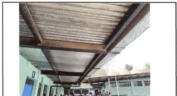
Foto 6: Oxidación en la estructura del techo y problemas de filtración principalmente en juntas y tornillos, por lo que se deberá realizar el mantenimiento.