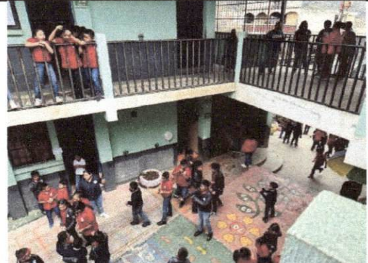
Foto 10: Patio 1 es el espacio en el que los niños desarrollan sus actividades físicas y de recreación.