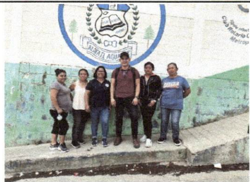
Foto 12: Fotografía con directora y OPF, al terminar la visita de campo.