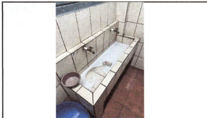
Foto 3: Los chorros actualmente presentan fallas en el sistema de cerrado.