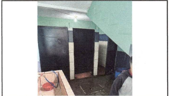
Foto 2: Las puertas presentan oxidación principalmente en la parte inferior.