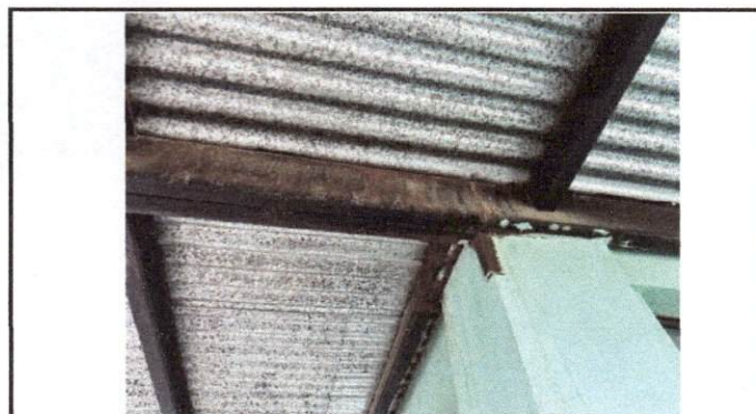
Foto 5: Se muestra los daños en la estructura del techo a causa de la oxidación por falta de mantenimiento.