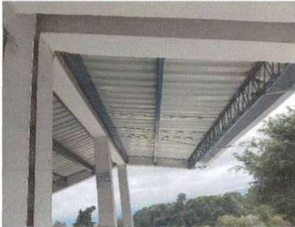
Foto1 TERMINACION DE TECHO