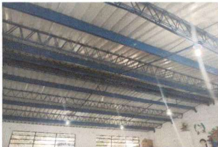
Foto 5 RECOLOCACION DEL SISTEMA ELECTRICO