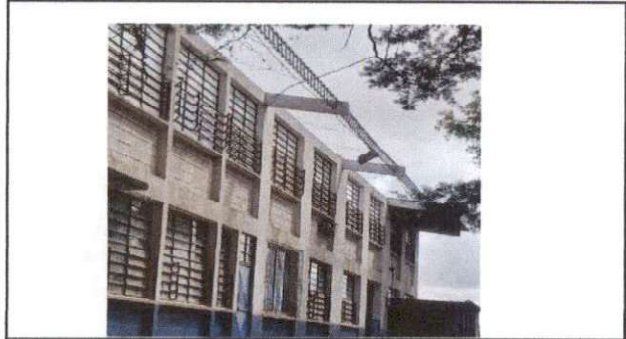
Foto 1 DESTECHADO