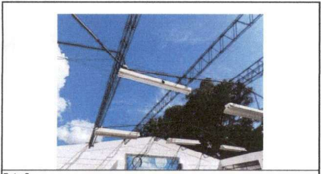
Foto 5 CUIDADON DEL SISTEMA ELECTRICO