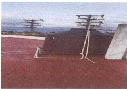
Foto 5: MODULO 2, FINALIZACION DE IMPERMEABILIZACION DE LOSA, AULA SEXTO