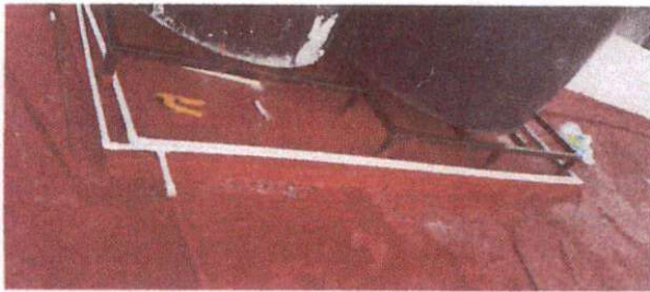
Foto 3: MODULO 2, FINALIZACION DE IMPERMEABILIZACION DE LOSA, AULA DE SEGUNDO