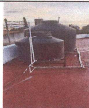
Foto 2: MODULO 2, FINALIZACION DE IMPERMEABILIZACION DE LOSA, AULA TERCERO