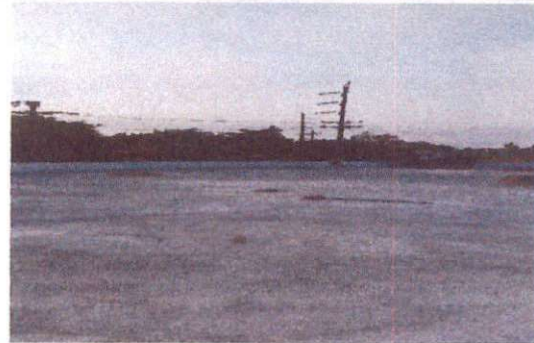
Foto 4: MODULO 2 FINALIZACION DE IMPERMEABILIZACION DE LOSA EN PASILLO