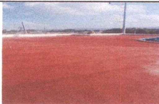
Foto 6: MODULO 2, FINALIZACION IMPERMEABILIZACION DE LOSA, AULA DE DIRECCION J.V., BAÑO DE DOCENTES, COCINA DE LA TARDE Y BAÑO DE NIÑAS.

Observación: Si es necesario se pueden agregar hojas adicionales y actualizar el número de hojas.