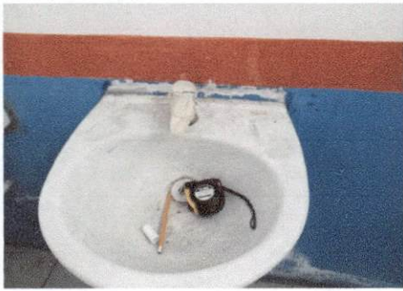
Foto 1: LAVAMANOS DE NIÑOS. MÓDULO DE SERVICIO DE SANITARIOS, SE ESTÁ DESMONTANDO