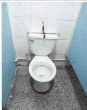
Foto1: SANITARIO DE LAS NIÑAS