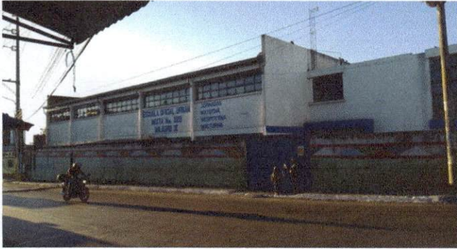
Foto1: Frente y entrada de la EOUM No.129 MILAGRO II J.V.