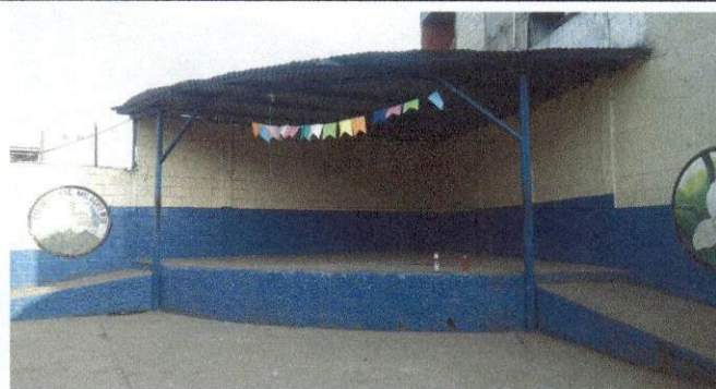
Foto 5: Cernido y pintura de la parte del suelo del escenario y colocación de tubo en la parte de arriba para facilitar la colocación de material.