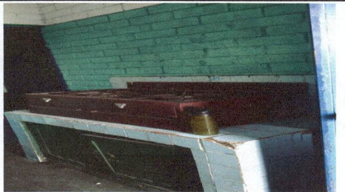
Foto 3: Instalación de pila, mesa, piso, azulejos, drenaje, tubería para agua potable para un espacio apropiado para la preparación de alimentos.