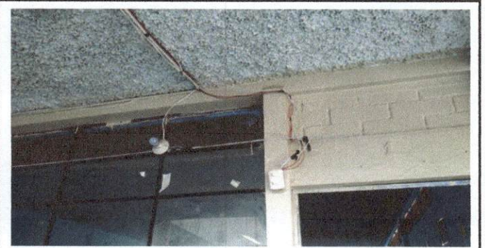
Foto 6: Reparación del sistema eléctrico, ya que nuestros salones no cuentan con energía eléctrica y la poca instalación no se encuentra en buen estado, ni adecuadamente.

Observación: Si es necesario se pueden agregar hojas adicionales y actualizar el número de hojas