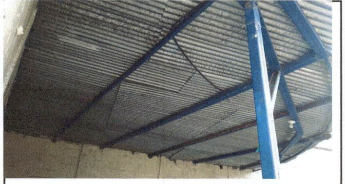
Foto 4: El escenario no cuenta con buen techo ya que las laminas que tiene son muy pequeñas y eso no ayuda el deslizamiento de agua por la lluvia.