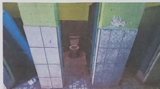
Foto 4: SE QUITARÁ EL AZULEJO EXISTENTES PARA RESANAR PAREDES Y UNIFICAR CON EL NUEVO AZULEJO