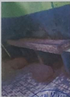
Foto 11: SE MUESTRA LOS LAVAMANOS NO CUMPLEN CON LOS REQUERIMIENTOS PARA NIÑOS RAZON POR LA CUAL FUNDIERON ESTAS GRADAS, SE DEMOLERA Y REALIZARA UN MODULO PARA NIÑOS