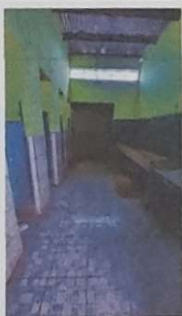
Foto 3: EL ESTADO DE LA BATERIA DE SANITARIO ACTUALMENTE ES TOTALMENTE DAÑADA POR LO QUE ES NECESARIO REMOZAMIENTO TOTAL DEL ÁREA