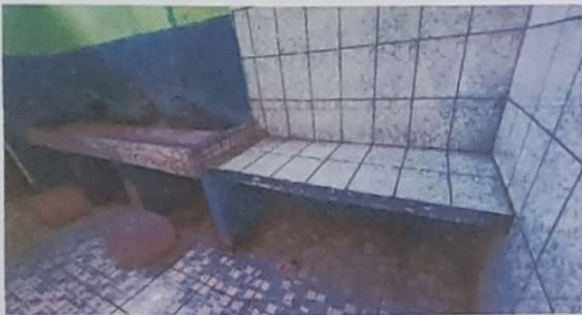
Foto 7: DEMOLERA EL MODULO DE LAVAMANOS, SE QUITARA EL AZULEJO Y SE RESANARAN LAS PAREDES