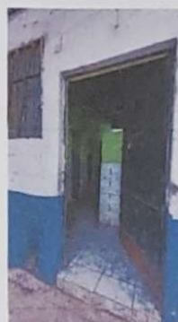
Foto 2: SE COLOCARÁ UNA PUERTA NUEVA EN EL INGRESO DE LOS SANITARIOS