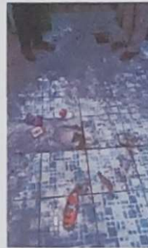
Foto 8: EL PISO ESTA DETERIORADO POR LO QUE SE COLOCARÁ PISO DE GRANITO