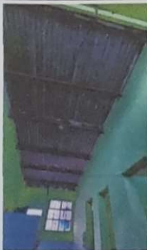
Foto 9: LA ESTRUCTURA METÁLICA Y LA LÁMINA SE ENCUENTRA EN MAL ESTADO POR LO QUE SE CAMBIARÁ