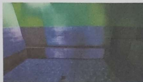
Foto 6: SE DEMOLERAN LOS URINALES ACTUALES YA QUE NO CUMPLEN CON LAS MEDIDAS NECESARIAS PARA NIÑOS

[Firma] Oficina Ejecutiva de la Junta Escolar Comunal San José La Comandante - Mixco, Guatemala