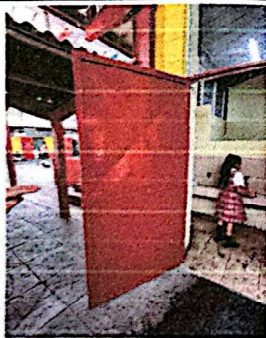
Foto 3: Mantenimiento a puerta de baño incluye Sustitución de 15 Cm en la parte inferior + lijado + pintura.