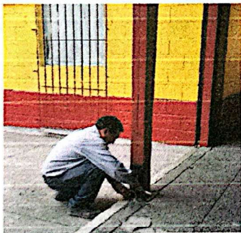
Foto 9: Trabajos de sustitución de la parte inferior en columnas dañadas.