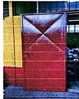
Foto 4: Mantenimiento a puertas de módulo de aulas + lijado + pintura.