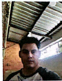
Foto 12: Fotografía en el establecimiento al finalizar la visita de campo.