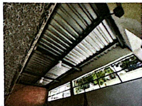
Foto 6: Instalación de lámina troquelada + energía eléctrica para iluminación.