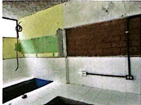
Foto 2: Suministro e instalación de azulejo en formato de 20 x 30 centímetros.