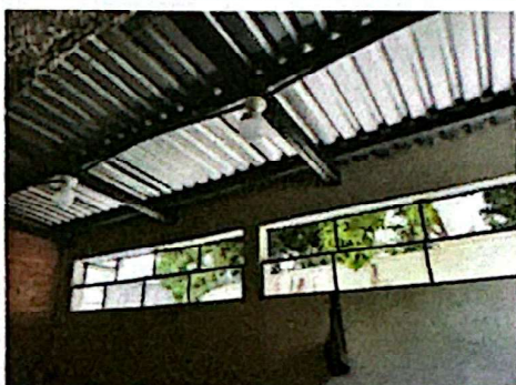
Foto 5: Armado de estructura de soporte para lámina troquelada + ventana tipo sifón.