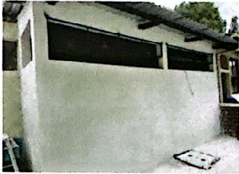
Foto 7: Aplicación de monocapa, gris y blanco para acabado en muros de cocina.