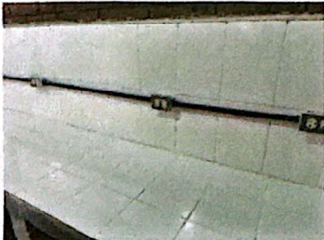
Foto 1: Suministro e instalación de energía eléctrica de fuerza, incluye cableado, ducto, cajas y tomacorrientes.