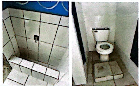
Foto 10: Fabricación de mingitorio en baño de niños + colocación de piso y azulejo en baños.