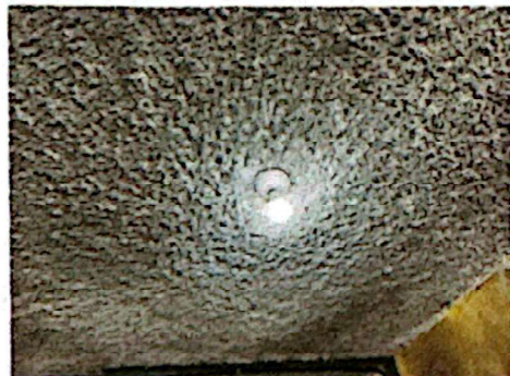
Foto 4: Suministro e instalación de energía eléctrica para iluminación, incluyendo cableado + lámpara ahorradora.