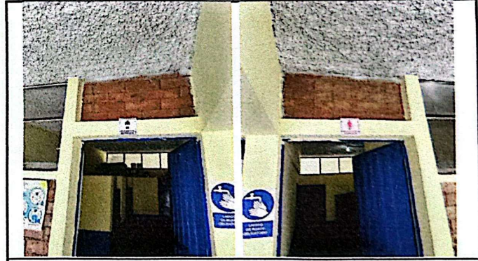
Foto 4: Para lograr una ventilación cruzada se solicita la demolición de el muro de ladrillo y colocar una ventana tipo sifón.