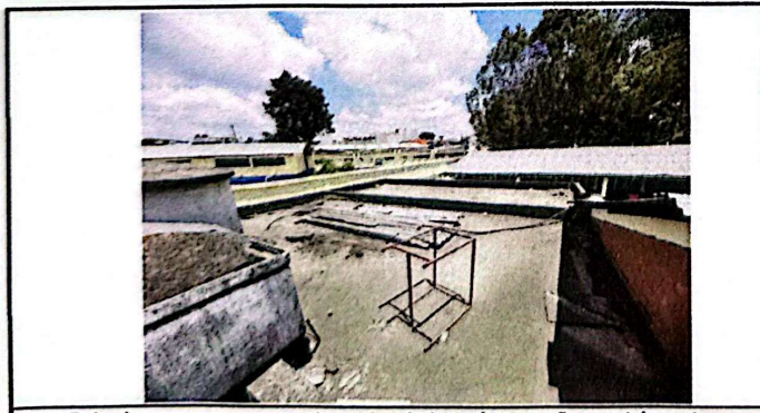
Foto 5: La losa que se encuentra sobre la batería de paños y el área de cocina, presenta fisuras.