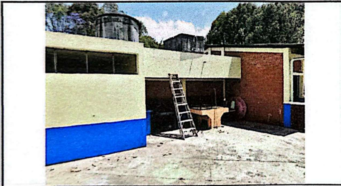
Foto 3: Ampliar la cocina, permitirá a la OPF poder realizar de mejor manera los alimentos de los niños.