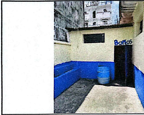
Foto 10: Al igual que el otro servicio sanitario, en este también se pretende realizar una remodelación que permita tener los inodoros por separado.