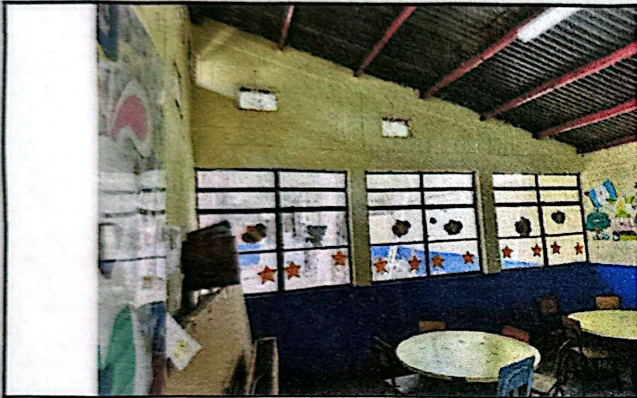
Foto 9: En la parte superior se realizará la apertura del vano en la forma de trapecio, para poder colocar una ventana que permita ventilar de mejor manera.