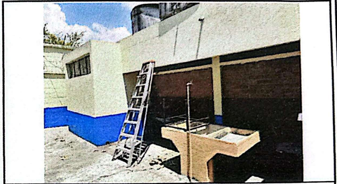
Foto 2: Área destinada para la ampliación de la cocina, y tener un acceso directo a la pila mediante la generación de una puerta en el muro contiguo a la escalera.