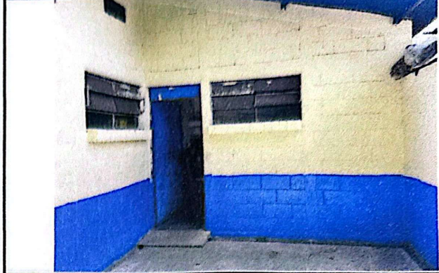
Foto 8: En este espacio funcionan los servicios sanitarios de manera mixta, por lo que se pretende realizar la división de los mismos.