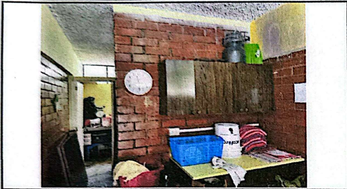
Foto1: - Muros internos que deberán ser demolidos hasta una altura de 80 cm para posteriormente usarlos como base para las mesas de trabajo.