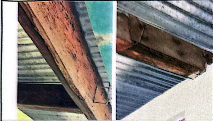
Foto 7: Se puede apreciar que la madera de estructura del techo ha sufrido daños por humedad y plagas, por lo que algunas piezas deberán ser sustituidas.