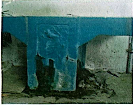
Foto 1: Pilas en mal estado. Cambio de las misma en cocina y patio