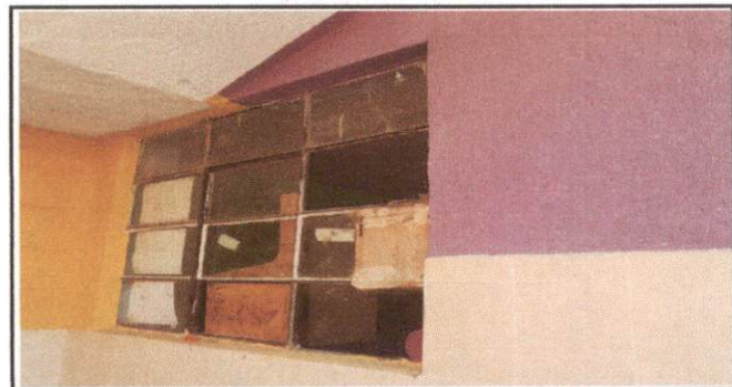
Foto 6: Ventana del salon la cual se encuentra en mal estado por lo que sera cambiada por una Ventana totalmente nueva de PVC.

Observación: Si es necesario se pueden agregar hojas adicionales y actualizar el número de hojas.