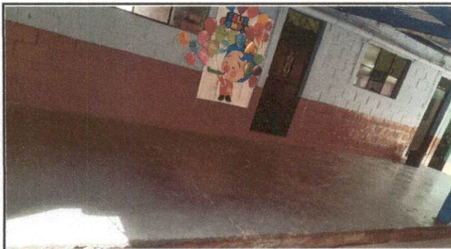
Foto 3: Patio externo de aulas que sera cambiado por piso ceramino.