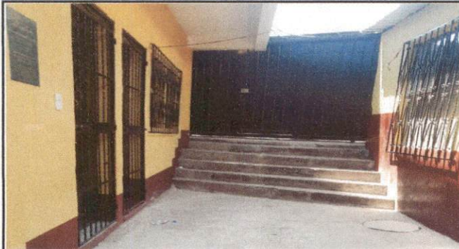
Foto1: Area de ingreso donde se colocara una rampa para sustituir las gradas y facilitar el ingreso de los alumnos.