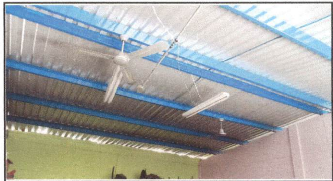
Foto 4: Techo de salon al cual se le colocara techo falso para mejorar el ambiente dentro del salon y reducir el calor ocasionado por el techo de lamina.