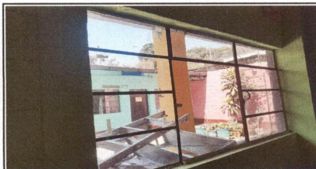
Foto 5: Ventana del salon la cual se encuentra en mal estado por lo que sera cambiada por una Ventana totalmente nueva de PVC.