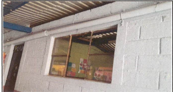
Foto 2: Ventana del salon la cual se encuentra en mal estado por lo que sera cambiada por una Ventana totalmente nueva de PVC.