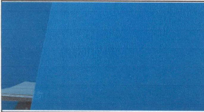
APLICACION DE REPELLO EN PAREDES