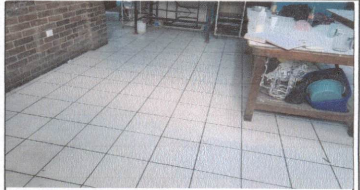
APLICACIÓN DE PISO EN AREA DE COCINA