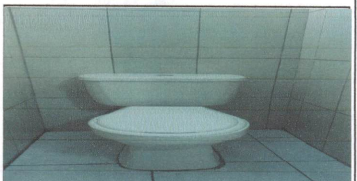
INSTALACION DE PISO EN AREA DE BAÑO

Observación: Si es necesario se pueden agregar hojas adicionales y actualizar el número de hojas.