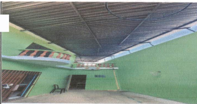
PINTURA DE TECHO