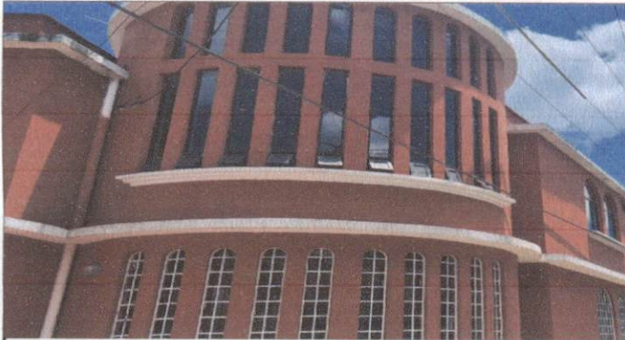
APLICACIÓN DE PINTURA EN PAREDES EXTERIORES DEL ESTABLECIMIENTO