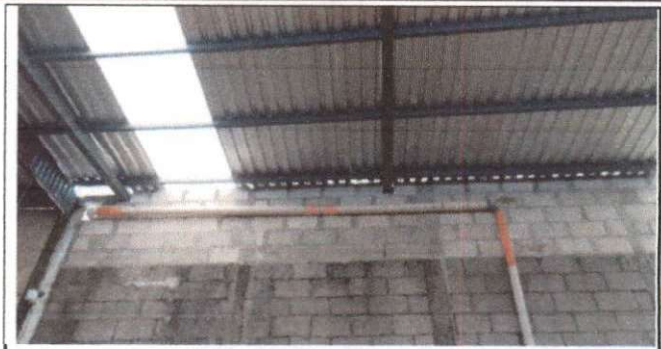
Foto 2: Area de patio que se remodeló para evitar que se mojen los alumnos en tiempo de lluvia, y también es espacio adecuado para los actos cívicos, culturales y deportivos.