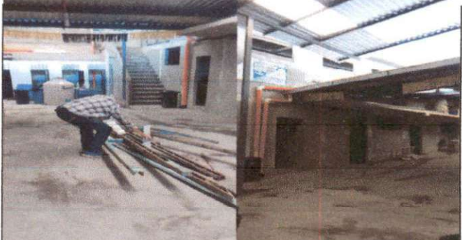
Foto 4: Así quedó la colocación de techo la que era necesario para cubrir de la lluvia aire y rayos del sol.