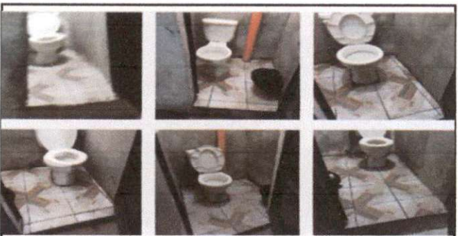
Foto 6: Esos son los sanitarios que se les colocó piso cerámico, el sanitario ubicado a la derecha fue cambiado por uno nuevo, y el primero a mano izquierda se le instaló lavamanos.

Observación: Si es necesario se pueden agregar hojas adicionales y actualizar el formulario.