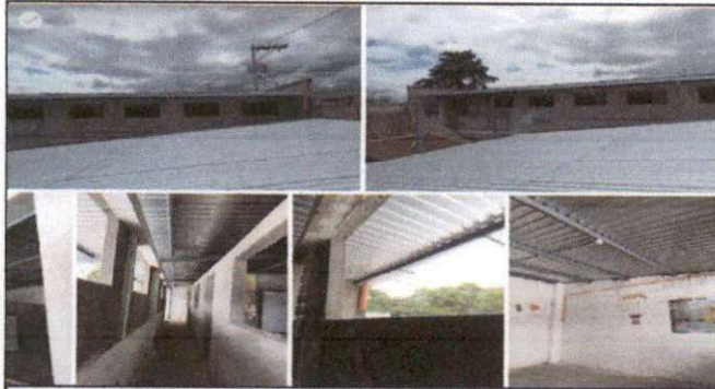
Foto1: 4 SALONES DE CLASE EN 2º NIVEL INEB J.V