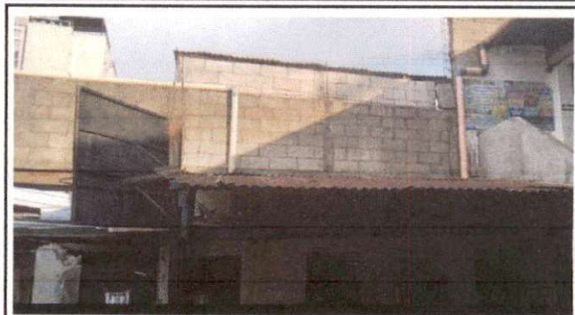
Foto 2: Area de patio que necesita ser remodelada para evitar que se mojen los alumnos en tiempo de lluvia, y tambien es espacio adecuado para los actos civicos, culturales y deportivos.