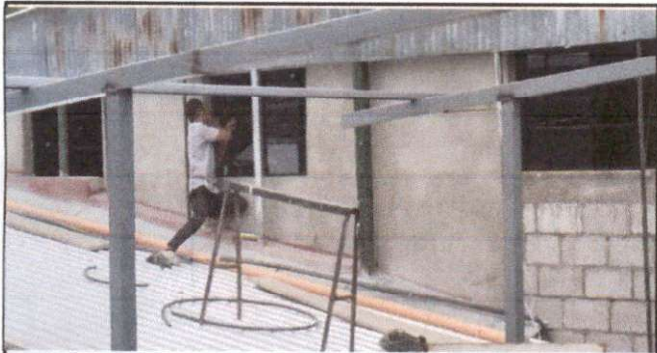
Foto 3: En ese vacio se estan colocando las ventanas dos en cada salón