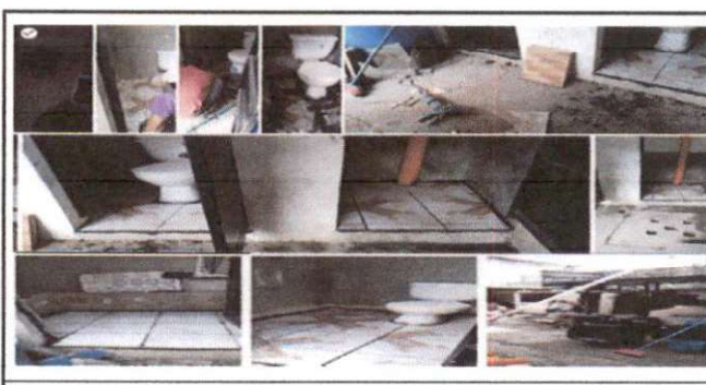
Foto 6: Esos son los sanitarios que se les va a colocar piso caramico, el sanitario ubicado a la derecha sera cambiado por uno nuevo, y el primero a mano izquierda se le colocará lavamanos.

Observación: Si es necesario se pueden agregar hojas adicionales y actualizar el número de hojas.