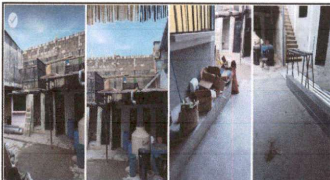
Foto 4: El clima (lluvia, aire, polvo y rayos del sol) afectan a los alumnos en sus actividades diarias, poe eso es necesario la colcación de ventanas.