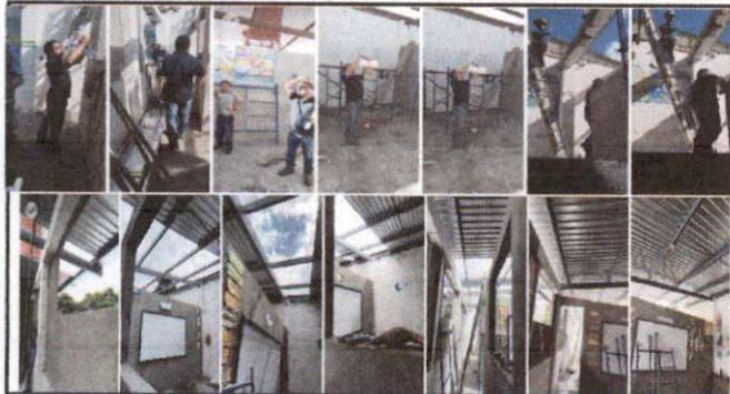
Foto1: 4 SALONES DE CLASE EN 2º NIVEL INEB J.V