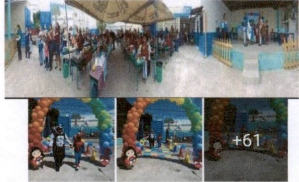
Foto 4: El clima (lluvia y rayos del sol extremo) es uno de los factores que mas ha afectado a los niños en sus actividades diarias.