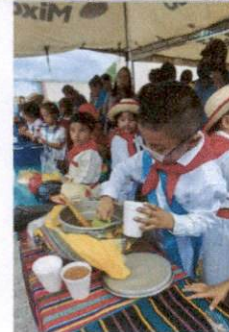
Foto 6: En muchas actividades se ha tenido que buscar soluciones como prestar toldos a la municipalidad para protegernos del sol, la lluvia, etc. Pero no son suficientes.

Observación: Si es necesario se pueden agregar hojas adicionales y actualizar el número de hojas.