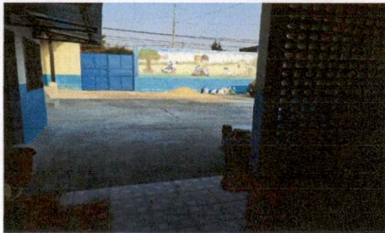
Foto 5: Gracias a que se cuenta con una pared perimetral se facilitara la instalacion del techado del patio.