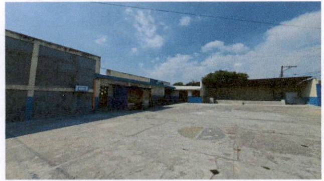
Foto 2: Area del patio que necesita ser techada para proporcionar a los niños, padres y docentes un espacio adecuado para los actos cívicos, culturales y deportivos.