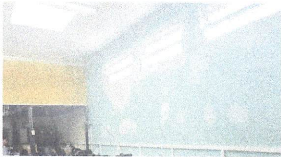
Implementación de ventanas