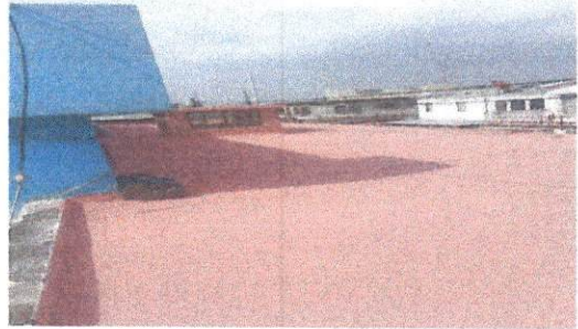
Impermeabilización de loza