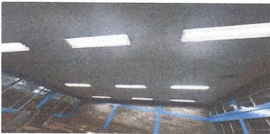
Sustitución de tubos en lámparas tipo Led