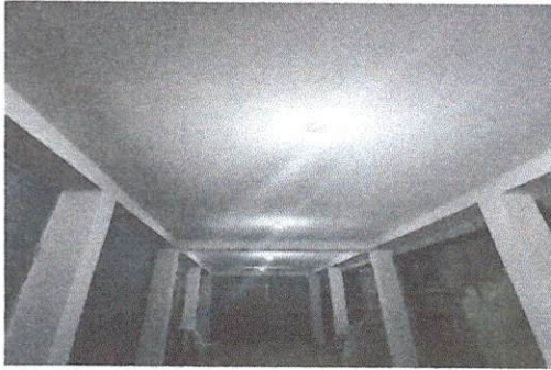
Cambio de techo de lámina a terraza