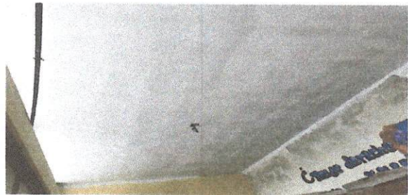
Repello en terraza, cielo interno

Observación: Si es necesario se pueden agregar hojas adicionales indicando el número de hojas.