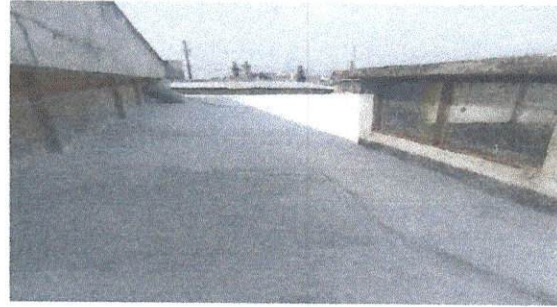
Impermeabilización de loza