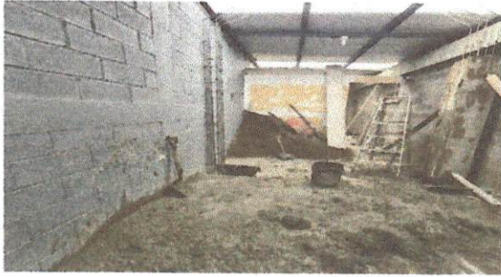
Cambio de techo de lámina a terraza