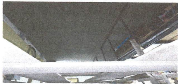
Repello en terraza, cielo interno

Observación: Si es necesario se pueden agregar hojas de organización de número de hojas.