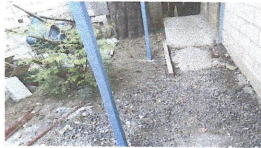
Reparación de plancha de concreto