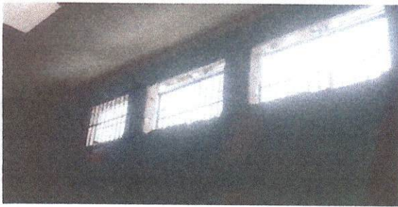
Implementación de ventanas