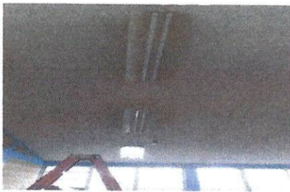
Sustitución de tubos en lámparas tipo Led