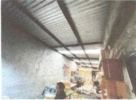
Foto 1. Cambio de techo de lámina a terraza en área de 15*3 metros, incluye fabricación de terraza con estructura de hierro, fundición (material y mano de obra) desinstalación de estructura portante y de lámina