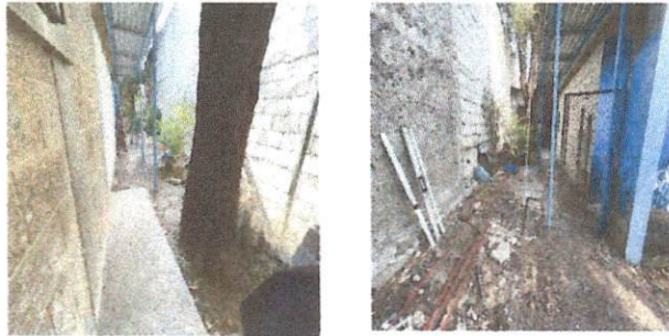
Foto 4. Reparación de planchas de concreto de patio en área de 3.5*2.2 metros * 8 centímetros de espesor