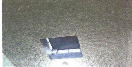
Foto 2. Impermeabilización de losa en área de 3.5*20.5 metros, incluye servicio de aplicación y material para 5 años