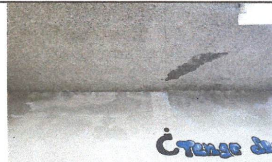
Repello en terraza cielo interno, quitar repello dañado y aplicación del nuevo en área de 3.5*20.5 metros (incluye mano de obra y material)

Observación: Si es necesario se pueden agregar hojas adicionales y actualizar el número de hojas.