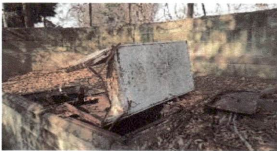
foto 3 Habilitación de deposito de basura para una mejor utilización.