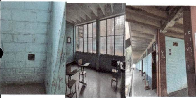
foto 5 Pintura interior y exterior sustitución de interruptores y sistema eléctrico de paballeon No. 2 .