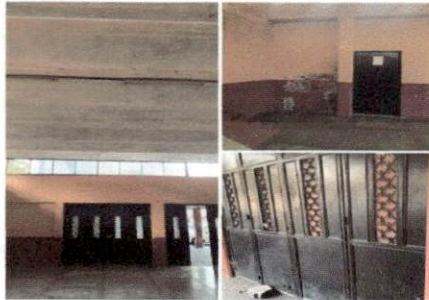
Foto 1 Pintura interior de Salon de Usos multiples.