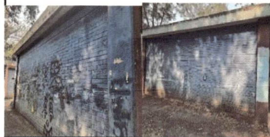
foto 6 Pintura de otros lugares del establecimiento. Paredes del fondo de los pabellones 1 y 2.

Observación: Si es necesario se pueden agregar hojas adicionales y actualizar el número de hojas.