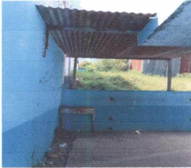
20.2 Sustitución de estufa rural (completa) incluye chimenea y plancha de metal