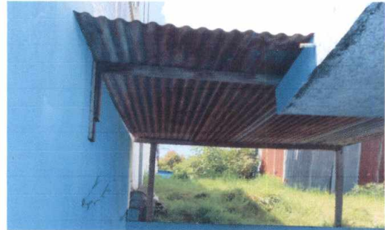
2.2 Sustitución de estructura de soporte de madera, por metal. Colocación de Costaneras de metal.