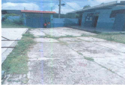
6.1 Sustitución de piso de concreto 10cm de grosor con electromaya.