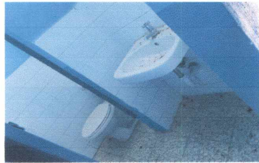
10.5 Sustitución de lavamanos. Quitrlo donde esta y colocarlo en otro lugar.