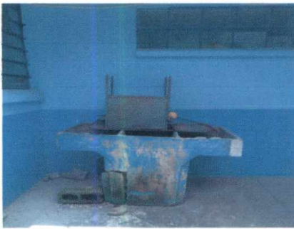
20.1 Sustitución de pila de cemento de dos lavadero.