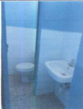
10.8 Sustitución de Mingitorio. En ese lugar hay un lavamanos y se colocara un mingitorio.