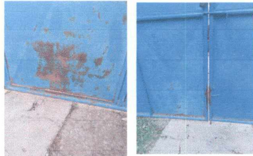
4.1 Mantenimiento a estructura de Porton de ingreso. (lijado, cambio de tubo, cepillado)