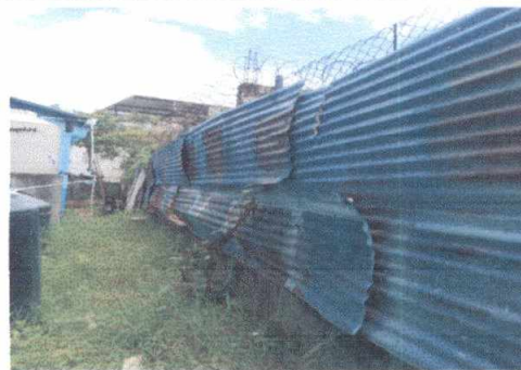
15.1 Reparación de muro perimetral de block. Sustituir el acual que es de maya metalica.

Observación: Si es necesario se pueden agregar hojas adicionales y actualizar el número de hojas.