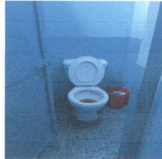
10.6 Sustitución de inodoros a tipo baby.