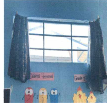
5.2 Sustitución de estructura de metal de ventana. Ampliación de ventana y que abra tipo corrediza y sus vidrios.

Observación: Si es necesario se pueden agregar hojas adicionales y actualizar el número de hojas.