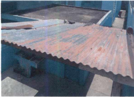
1.1 sustitución de lámina por lámina troquelada aluzinc calibre 26. cambio de techo de galera de polleton.