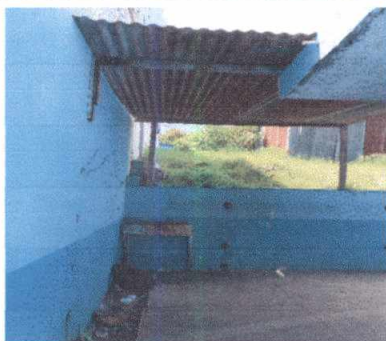
14.9 Sustitución de tubería principal. Para reinstalar pila de dos lavaderos y deposito de agua.