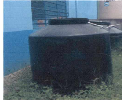
18.2 Sustitución de de deposito de agua 1100 lts. Reinstalación de deposito a otra ubicación.