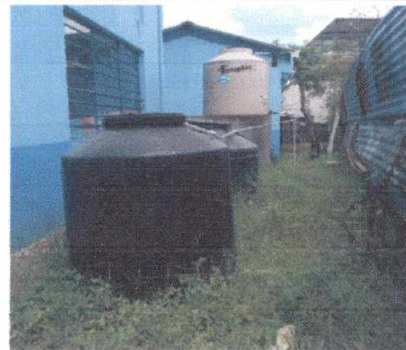
18.1 Sustitución de de deposito de agua 1100 lts. Reinstalación de deposito a otra ubicación.