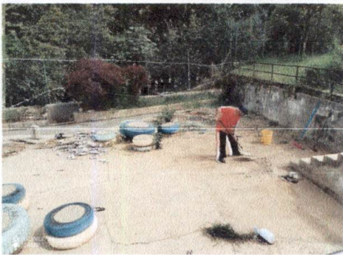
Foto 1 Reparación de muro perimetral.