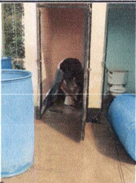
Foto 1 Sustitución sanitarios y accesorios.