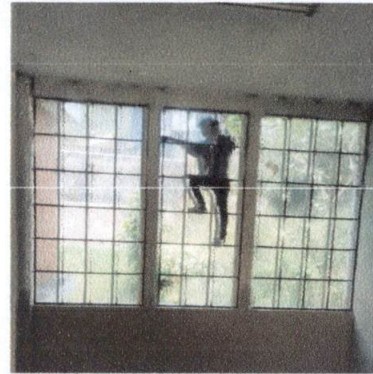
Foto 1 Sustitución de vidrios de ventanas.