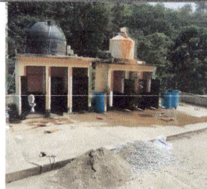
Foto 1 Mantenimiento de Cisternas.