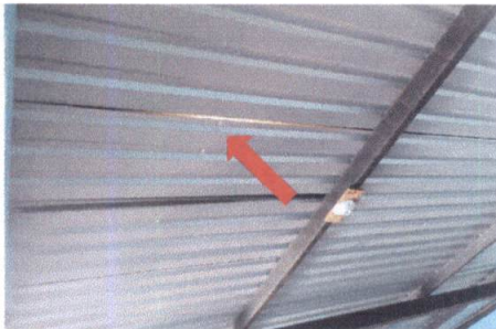
Foto 3: REPARACIÓN DE TECHO Desmontaje e instalación de techo en 3C.