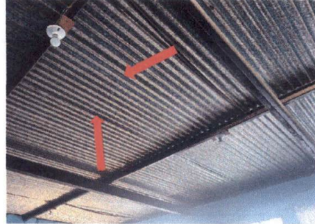
Foto 2: ESTRUCTURA DE TECHO Instalación de tendales de 152 M2 en corredor de segundo piso al fondo y aulas de 3ro. A, 2do. A, 2do. C, 3ro. B y 2do. B.