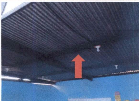
Foto 5: CUBIERTA DE LAMINA Sustitución de lámina acanalada por lámina troquelada calibre 26 en corredor de segundo piso al fondo y aulas de 3ro. A, 2do. A, 2do. C, 3ro. B y 2do. B.