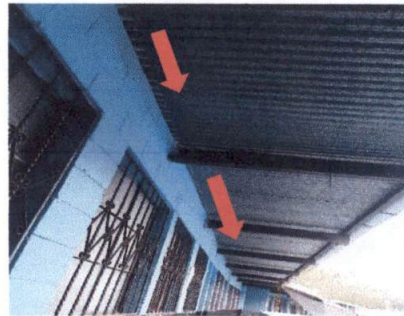
Foto 6: CUBIERTA DE LÁMINA Sustitución de lámina acanalada por lámina troquelada calibre 26 en corredor de segundo piso al fondo y aulas de 3ro. A, 2do. A, 2do. C, 3ro. B y 2do. B.

Observación: Si es necesario se pueden agregar hojas adicionales y actualizar el número de hojas.