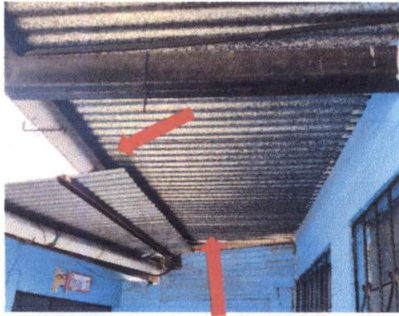
Foto 1: REPARACIÓN DE TECHO Instalación de tendales e instalación de canal en unión de módulos de techo .