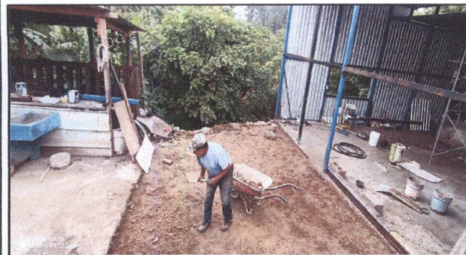
nivelacion y compactado para torta de patio previo