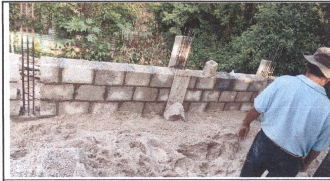
Rellenado y compactado de contrapiso y nivelando el muro de contencion