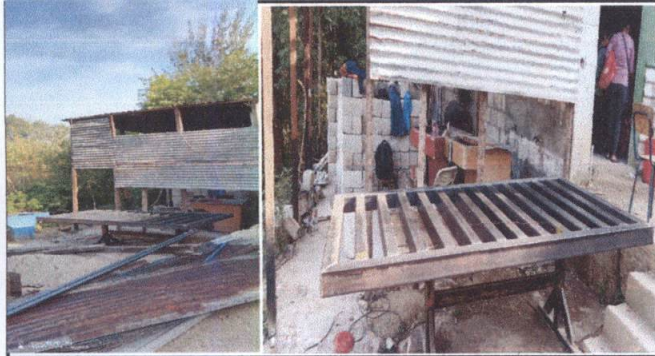
Desmantelamiento de la cubierta de la cocina existente