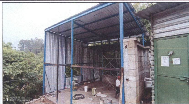
Instalacion de cubierta y techo