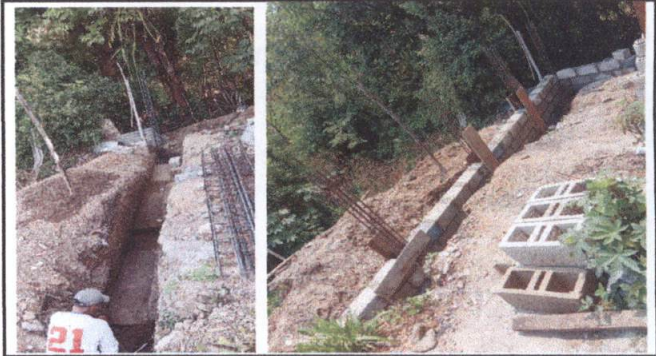
zanjeo de cimienzo y zapata y levantamiento de muro de muro de contencion