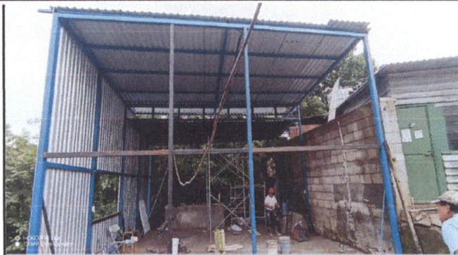
Techo y cubierta instalacion y estructura