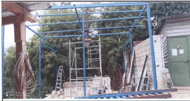
Fabricacion e instalacion de estructura de cubierta y techo

Observación: Si es necesario se pueden agregar hojas adicionales y actualizar el número de hojas.