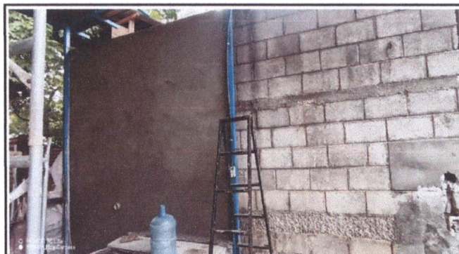
Cernido de pared remolineado