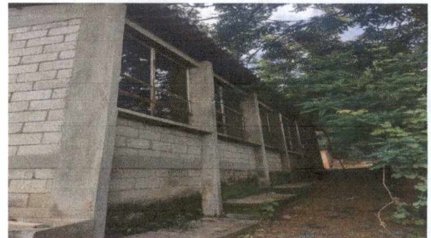
Foto 6: Aplicación de pintura por dentro y por fuera de las dos aulas más corredor debido a que se encuentran sucias y partes sin pintar.

Observación: Si es necesario se pueden agregar hojas adicionales y actualizar el número de hojas.