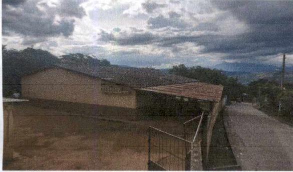
Foto 1: Sustitución de techo de duralita por lámina troquelada ya que presenta grietas y agujeros en su mayor parte.