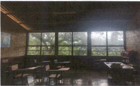
Foto 3: Mantenimiento de estructura de ventanas y cambio de seis ventanas de cada salón de la mitad hacia abajo ya que por el tiempo se sellaron por la suciedad y se encuentran en mal estado.