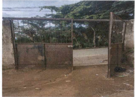
Foto 2: Sustitución de portón principal debido a que toda su estructura se encuentra oxidada, partes desniveladas y en mal estado.