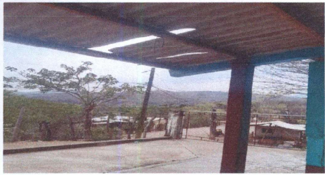
Foto 1: Sustitución de lámina por lámina troquelada aluzinc calibre 26 para dos aulas y la cocina incluye elementos de fijación. Y pintura de estructura de techo.