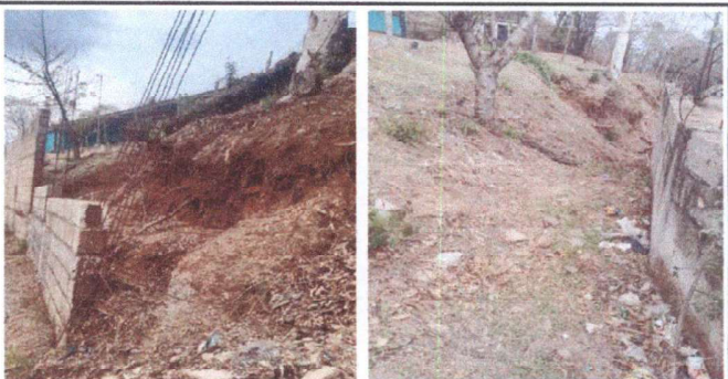
Foto 6: reparacion de muro de contencion y que tambien es muro perimetral que da a la calle principal

Observación: Si es necesario se pueden agregar hojas adicionales y actualizar el número de hojas