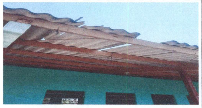
Foto 2: Sustitución de lámina por lámina troquelada aluzinc calibre 26 para dos aulas y la cocina incluye elementos de fijación. Y pintura de estructura de techo.