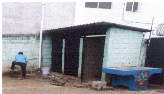
19.20 Instalacion de Pila de concreto (incluye conexión a drenaje)