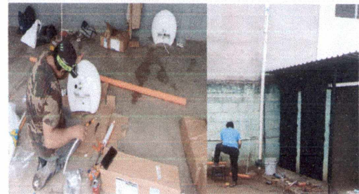
10.5 Sustitución de lavamanos

Observación: Si es necesario se pueden agregar hojas adicionales y actualizar el número de hojas.