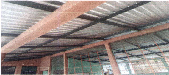
1.1 Sustitución de lámina, por lámina troquelada aluzinc calibre 26