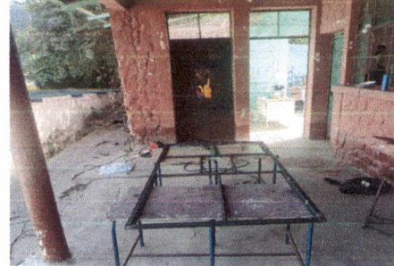
4.1 Mantenimiento a estructura (lijado, cambio de tubo , cepillado, sujeciones, aplicación de pintura)