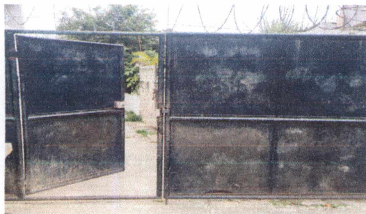
12.1 Mantenimiento a portones de metal