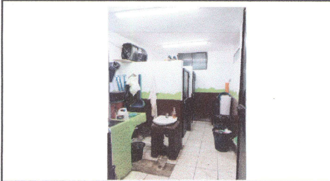
Foto1: Mejoramiento de sanitarios