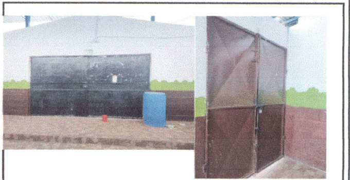
foto 4. Reparacion y mantenimiento de portones