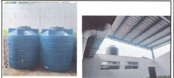
Foto 2: instalacion de las dos cisternas azules para la jornada matutina y reistalacion de las dos cisternas para la jornada vespertina