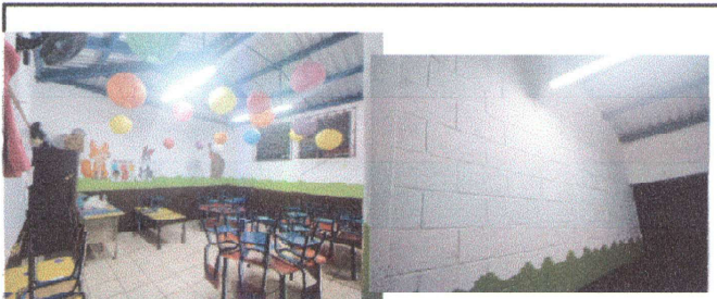
Foto 3: instalacion de 2 ventanas para iluminacion y ventilacion de aulas