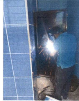
Mantenimiento de estructura