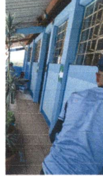
Pintura de exteriores