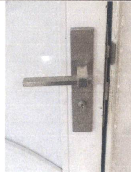
Sustitucion de Chapas