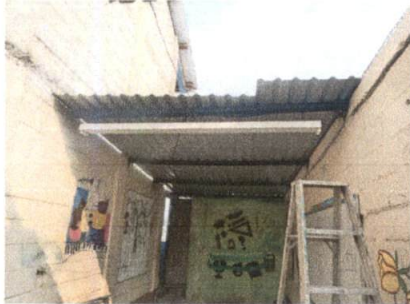
Sustitucion de lamina por lamina troquelada aluzinc calibre 26