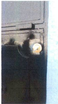
Sustitucion de Chapas