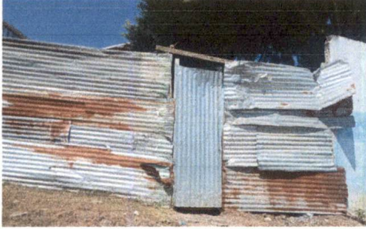
Sustitucion de portón