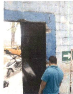
Sustitucion de puertas

Observación: Si es necesario se pueden agregar hojas adicionales y actualizar el número de hojas.