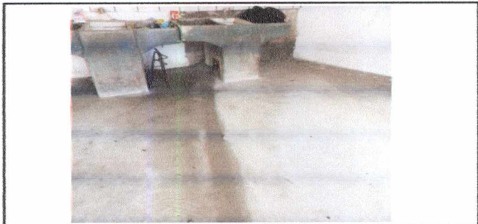
FOTO 9: (TRABAJO EXTRA) INSTALACIÓN DE 10ML DE DRENAJE PARA PILAS