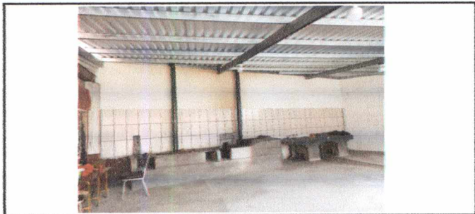
FOTO 11: FABRICACIÓN DE ESTUFA RURAL, INSTALACIÓN DE 2 CHIMENEAS PARA ESTUFA, INSTALACIÓN DE PISO DE CONCRETO EN COCINA