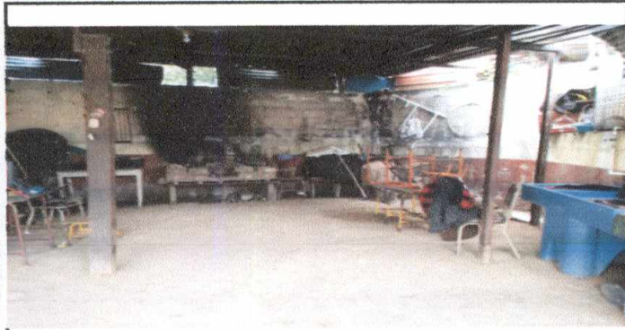
Foto1: 6.1 módulo Cocina fabricación loza de concreto