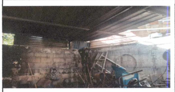
Foto 4: 20.14 Mejoramiento de pared de bloék en lado izquierdo del patio