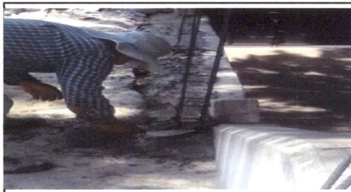
Foto 3: Reparacion de muro perimetral (Cimientos y levantamiento de muros)