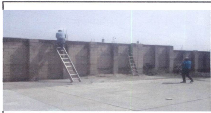
Foto 4: Reparación de cisterna de concreto, más bomba de agua, tablero, cableado eléctrico