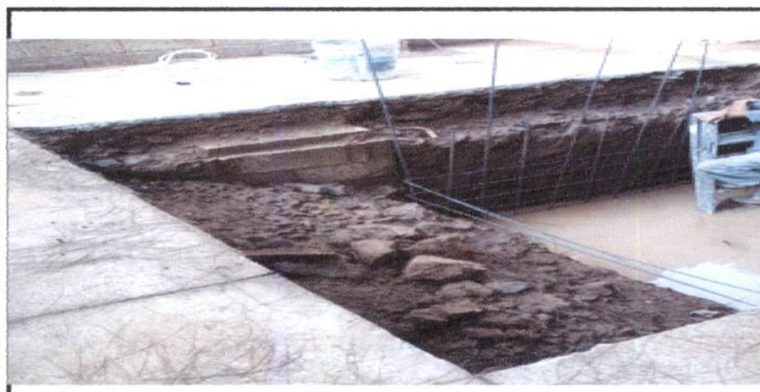
Foto 4: Reparación de cisterna de concreto, más bomba de agua, tablero, cableado eléctrico