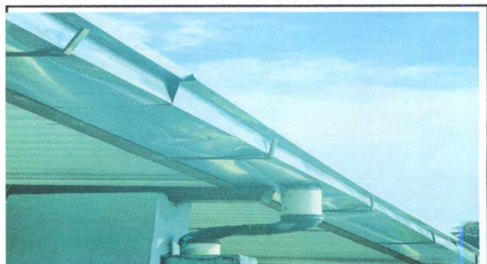
Foto 4: SUSTITUCION DE CANAL DE METAL (INCLUYE SUSTITUCIÓN DE 10 BAJADAS DE AGUA)