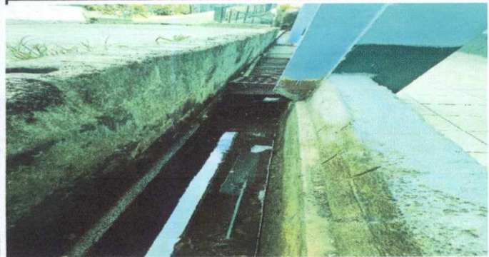
Foto 1: MATENIMIENTO A TAPADERAS DE METAL DE DRENAJE, CON UN ANCHO DE 50CMS. (INCLUYE LIJADO, APLICACIÓN DE PINTURA Y SUSTITUCIÓN DE PIEZAS DAÑADAS)