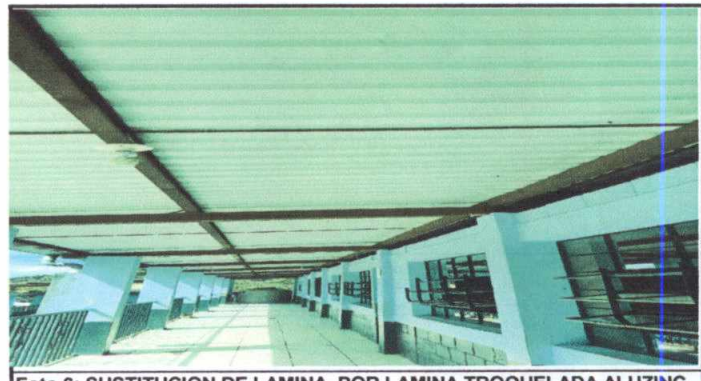
Foto 6: SUSTITUCION DE LAMINA, POR LAMINA TROQUELADA ALUZINC CALIBRE 26 (INCLUYE DESMONTAJE DE LÁMINA EXISTENTE E INSTALACIÓN DE LA NUEVA LÁMINA)

Observación: Si es necesario se pueden agregar hojas adicionales y actualizar el número de hojas.