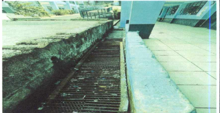
Foto 2: MATENIMIENTO A TAPADERAS DE METAL DE DRENAJE, CON UN ANCHO DE 50CMS. (INCLUYE LIJADO, APLICACIÓN DE PINTURA Y SUSTITUCIÓN DE PIEZAS DAÑADAS)