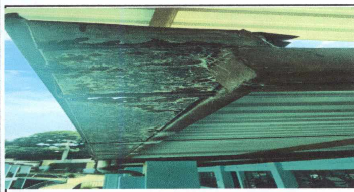
Foto 3: SUSTITUCION DE CANAL DE METAL (INCLUYE SUSTITUCIÓN DE 10 BAJADAS DE AGUA)