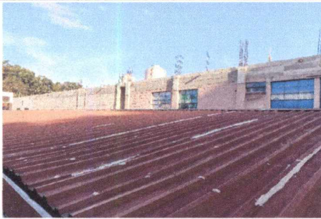
FOTO 1: SUSTITUCIÓN DE LEMENTOS DE FIJACIÓN PARA REPARACIÓN DE FILTRACIONES