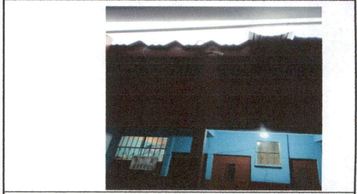
Foto 2: nivelación que se tiene que hacer, con filas de block y fundición de solera para levantar la altura del muro e instalar la nueva lámina.