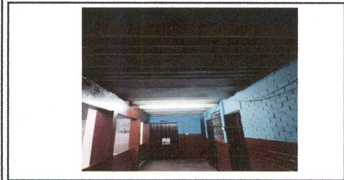
Foto 5: módulos que se cambiará techo por lámina y estructura metálica en aula, cocina, dos bodegas.