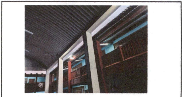
Foto 4: reja que se sustituirá del pasillo 2, tamaño de la nueva reja cubriría altura completa y ancho de viga a viga entre los espacios de cada columna.