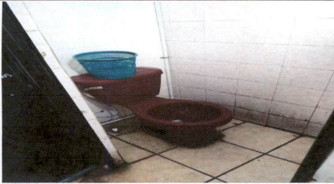
Foto13: SANITARIO NIÑAS