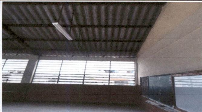
Foto1: LAMINA DE ADVESTO INTERIOR