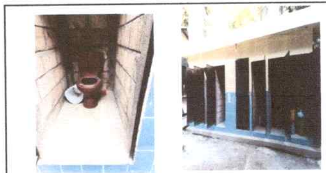
Reparación y sustitución de azulejos en los sanitarios