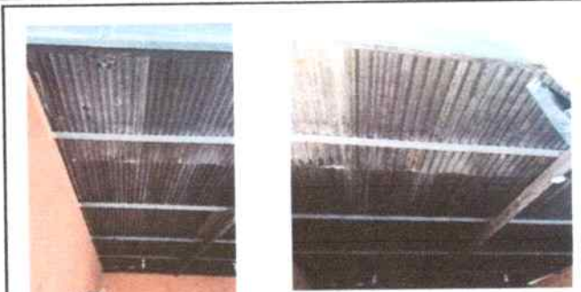
Laminas que se desean cambiar y costanera (estructura de Metal) que se desea reparar