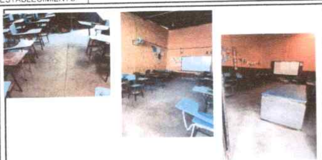
salones de clase donde se desea sustituir torta por piso