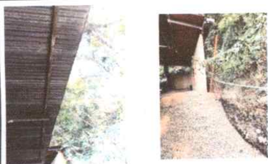
Costanera (estructura de metal) que se quiere reparar y colocar el canal que se cayó por deterioro asi como laminas que se cambiaran por deterioro.