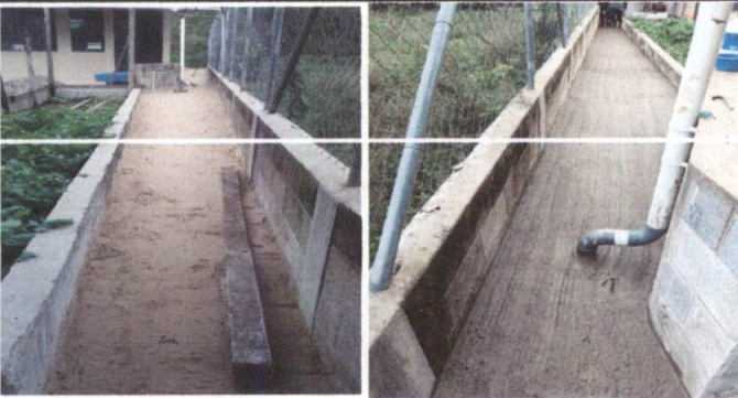
ARREGLO DE CUNETA YA CON ENTUBADO