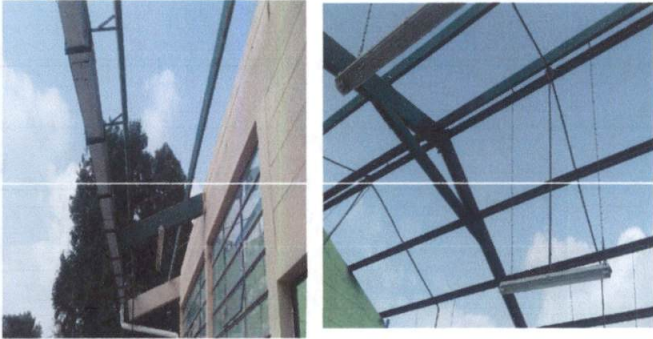
MANTENIMIENTO A ESTRUCTURA DE METAL DE TECHO Y SUSTITUCIÓN DE LÁMINAS Y CAPOTES