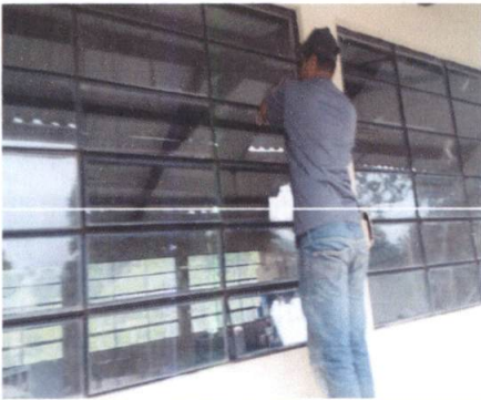
MANTENIMIENTO A ESTRUCTURAS DE VENTANAS Y SUSTITUCIÓN DE VIDRIOS ROTOS