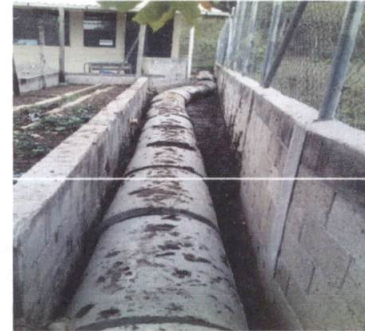
MANTENIMIENTO A CUNETA Y ENTUBADO DE AGUA PLUVIAL