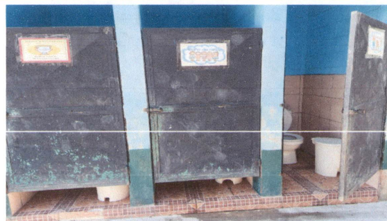
Foto 6: sanitarios, se debe arreglar ya que están conectados a una misma fosa y al echar agua en uno, se sale en el otro

Observación: Si es necesario se pueden agregar hojas adicionales y actualizar el número de hojas.