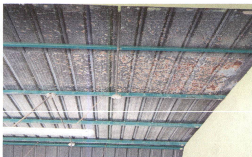
Foto1: lámina en mal estado, se encuentra picada y en invierno se cuela el agua de lluvia