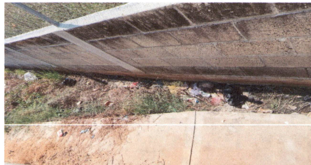
Foto 4: aquí se llena de agua en el invierno y es un peligro para los niños