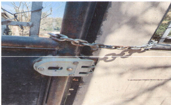
Foto 5: las chapas de los portones están descompuestas, por lo que se debe cerrar con candado y cadena