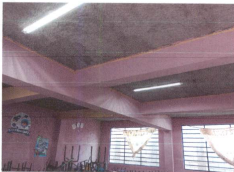
Foto 3: sustitucion de bombillas por lamparas led salones de clases