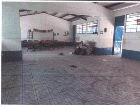
Foto 5: colocacion de piso cerámico antideslizante en salon de clases.