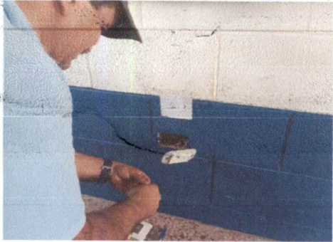
Foto1: sustitucion de tomacorrientes en salones de clases.