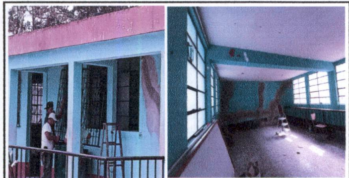
Foto 5: Mantenimiento del salon No.2 de paredes con grietas, y mantenimiento de ventanas, barandales, vidrio con maya, y puerta con cambio de chapa.