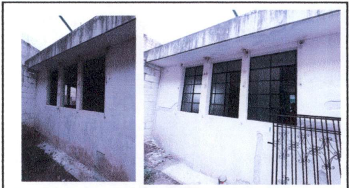
Foto 4: Mantenimiento de herreria del salon N1. de ventanas, balcones y colocación de vidrio enmayado, y de paredes grietadas, con cernido y blanqueado.