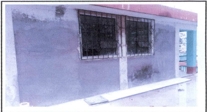
Foto 2: Parte lateral de la salida de emergencia, mantenimiento de la pared grietada, y con humedad, colocación de maya y aplicación de cernido y griciado.