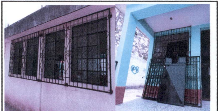
Foto 6: Mantenimiento de ventanas, balcones puertas y colocación de vidrios con maya en las ventanas de 4 salones, y modificación de ventanas corredizas.

Observación: Si es necesario se pueden agregar hojas adicionales y actualizar el número de hojas.