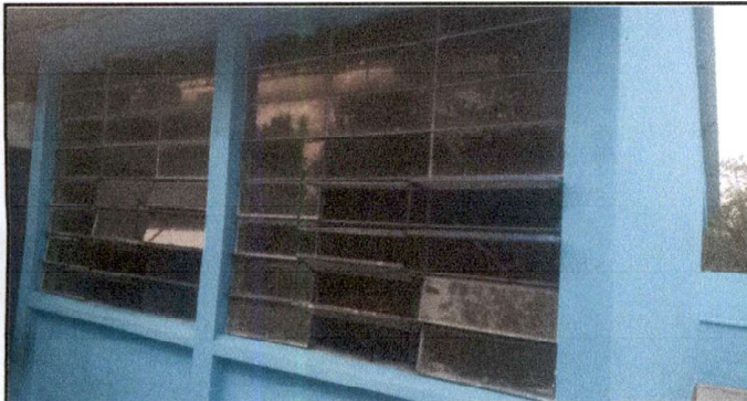
Foto 3: Sustitución de vidrios. ( los vidrios estan manchados no se han cambiado desde la creacion de la escuela año 1998. Solo se cambiarian algunos por que no alcanza el presupuesto)