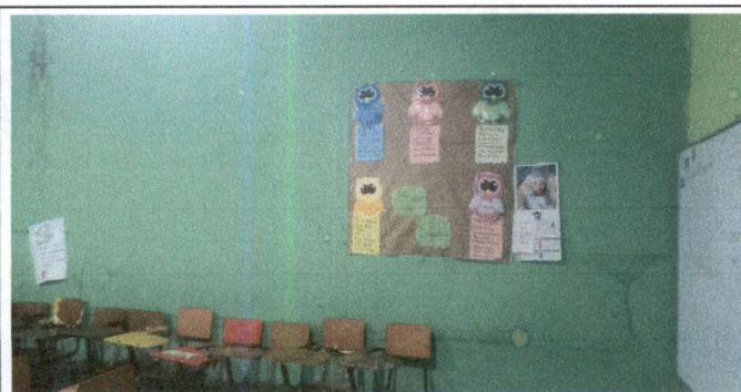
Foto 5: Sustitucion de division de madera y plywood por tubos de metal de 2 pulgadas y plywood. Aula No. 4