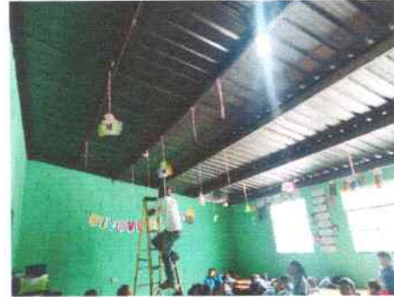
Foto 32: Se sustituyeron focos ahorradores en aulas de párvulos, segundo, tercero, cuarto y corredores.