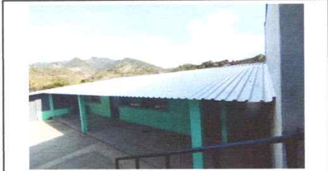
Foto 1: Aulas de Segundo y tercero primaria sse sustituyó lámina por lámina troquelada aluzin calibre 26 y mantenimiento a estructura de metal del techo (lijado, limpiado, sustitución de secciones de costaneras, pintura anticorrosiva)