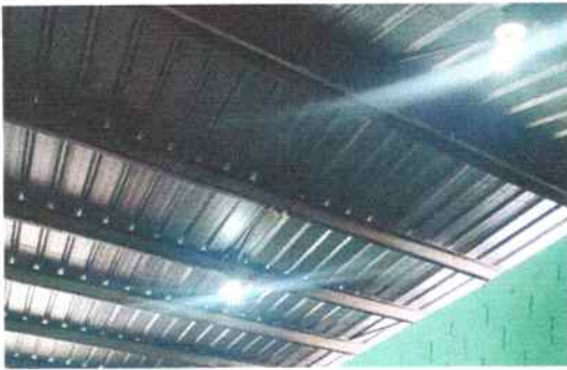
Foto 33: Se sustituyeron focos ahorradores en aulas de párvulos, segundo, tercero, cuarto y corredores.

Observación: Si es necesario se pueden agregar hojas adicionales y actualizar el número de hojas.