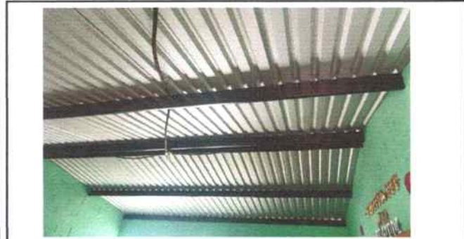
Foto 5: Aulas de Tercero primaria sse sustituyó lámina por lámina troquelada aluzin calibre 26 y mantenimiento a estructura de metal del techo (lijado, limpiado, sustitución de secciones de costaneras, pintura anticorrosiva)