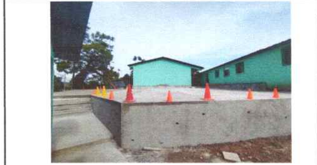
Foto 22: Se reparó losa de patio trasero (área recreativa) espesor 8cm.