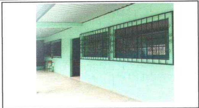
Foto 13: Aula de segundo primaria parte de enfrente se hizo mantenimiento a balcones de metal (pintura)