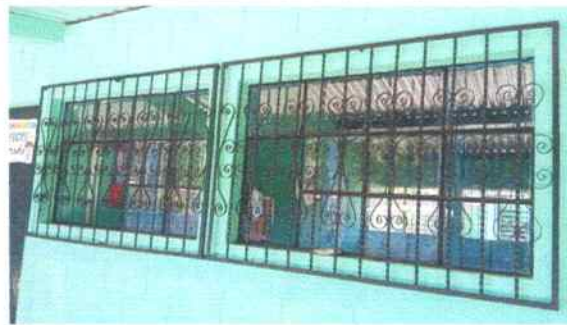
Foto 12: Aula de segundo primaria parte de enfrente se hizo mantenimiento a balcones de metal (pintura)

Observación: Si es necesario se pueden agregar hojas adicionales y actualizar el número de hojas.