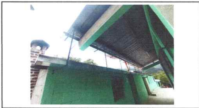
Foto 18: Colocación canal de metal incluye pescantes a cada metro incluye bajada

Observación: Si es necesario se pueden agregar hojas adicionales y actualizar el número de hojas.