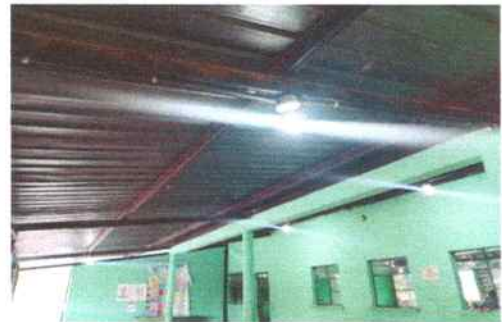
Foto 30: Se sustituyeron focos ahorradores en aulas de párvulos, segundo, tercero, cuarto y corredores.

Observación: Si es necesario se pueden agregar hojas adicionales y actualizar el número de hojas.