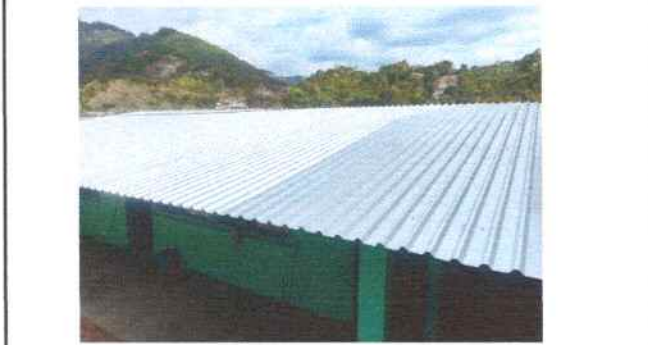
Foto 2: Aulas de Segundo y tercero primaria sse sustituyó lámina por lámina troquelada aluzin calibre 26 y mantenimiento a estructura de metal del techo (lijado, limpiado, sustitución de secciones de costaneras, pintura anticorrosiva)