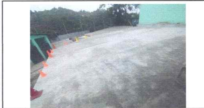
Foto 23: Se reparó losa de patio trasero (área recreativa) espesor 8cm.