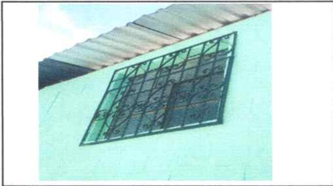
Foto 16: Dirección parte de atrás se hizo mantenimiento a balcón de metal (pintura)