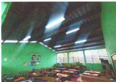
Foto 29: Se repararon lámparas de dos tubos cada una en el aula de primero primaria.