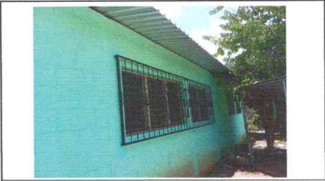
Foto 14: Aula de segundo primaria parte de atrás se hizo mantenimiento a balcones de metal (pintura)