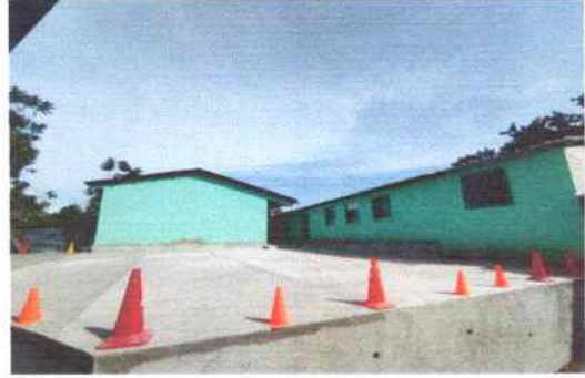
Foto 26: Se reparó losa de patio trasero (área recreativa) espesor 8cm, se hizo muro de block.