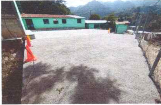
Foto 25: Se reparó losa de patio trasero (área recreativa) espesor 8cm, se hizo muro de block.