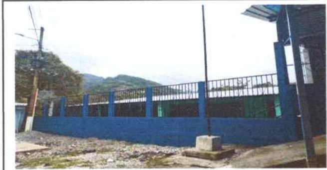
Foto 21: Se sustituyó balcones de metal en muro perimetral que da a la calle y se pinto el muro área exterior incluyó limpieza de paredes, cepillado y pintado.