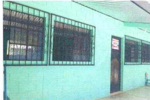
Foto 10: Aula de tercero primaria parte de enfrente se hizo mantenimiento a balcones de metal (pintura)