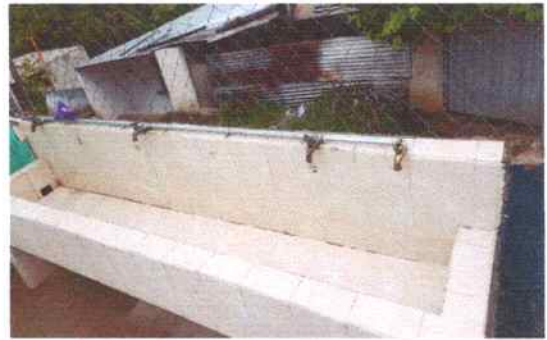
Foto 28: Se sustituyó la tubería línea principal suministro de lavamanos tuvo HG y Sustitución de llaves de chorro.