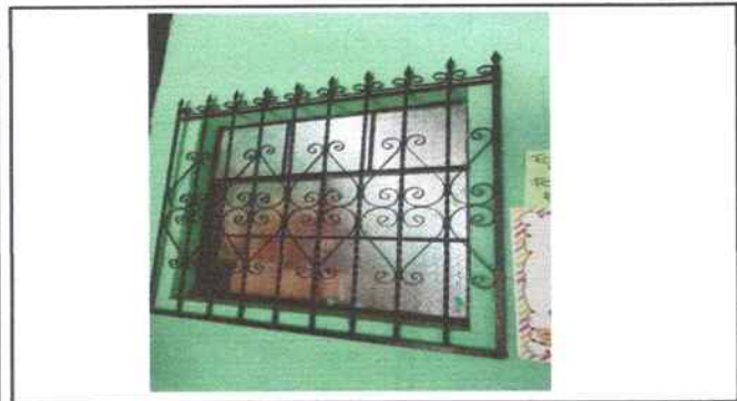
Foto 15: Dirección parte de enfrente se hizo mantenimiento a balcón de metal (pintura)