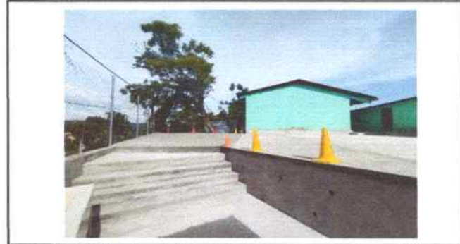
Foto 24: Se reparó losa de patio trasero (área recreativa) espesor 8cm, se hicieron gradas.

Observación: Si es necesario se pueden agregar hojas adicionales y actualizar el número de hojas.