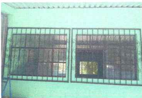
Foto 11: Aula de tercero primaria parte de enfrente se hizo mantenimiento a balcones de metal (pintura)