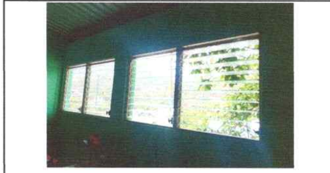
Foto 6: Ventanas del aula de tercero primaria, se realizó mantenimiento a marcos de aluminio mill finish y se colocaron vidrios (paletas).

Observación: Si es necesario se pueden agregar hojas adicionales y actualizar el número de hojas.