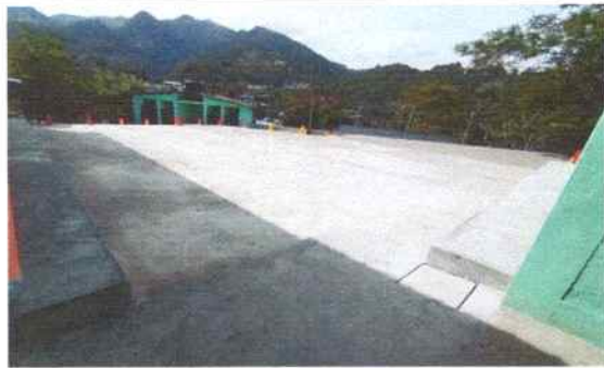
Foto 27: Se reparó losa de patio trasero (área recreativa) espesor 8cm, se hicieron bancas para reforzar las paredes de las aulas de párvulos, primero primaria.