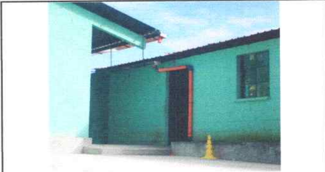
Foto 19: Colocación canal de metal incluye pescantes a cada metro incluye bajada