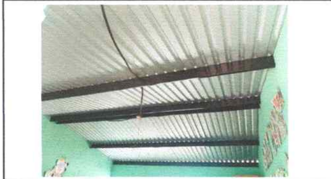
Foto 4: Aulas de Segundo primaria sse sustituyó lámina por lámina troquelada aluzin calibre 26 y mantenimiento a estructura de metal del techo (lijado, limpiado, sustitución de secciones de costaneras, pintura anticorrosiva)