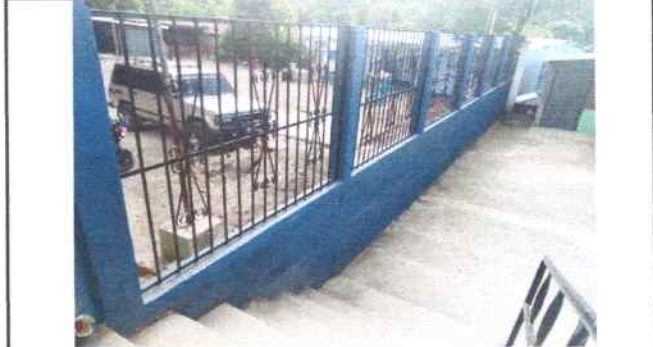
Foto 20: Se sustituyó balcones de metal en muro perimetral que da a la calle y se pinto el muro área interior incluyó limpieza de paredes, cepillado y pintado.