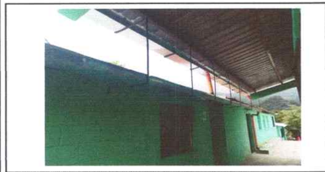
Foto 17: Colocación canal de metal incluye pescantes a cada metro incluye bajada