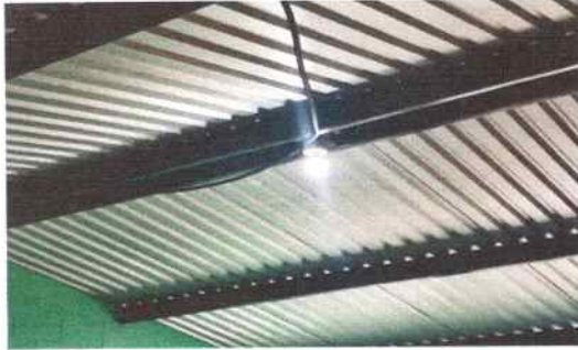
Foto 31: Se sustituyeron focos ahorradores en aulas de párvulos, segundo, tercero, cuarto y corredores.