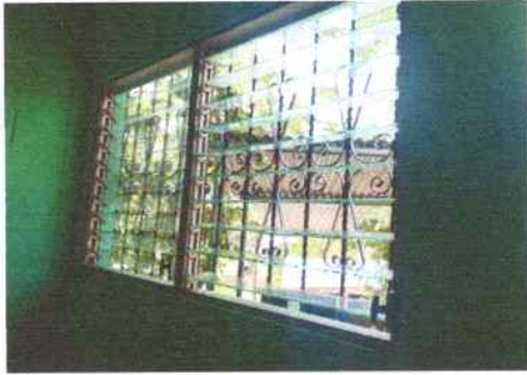
Foto 7: ventanas del aula de segundo primaria, se hizo mantenimiento a marcos de aluminio mill finill y se colocaron vidrio (paletas).