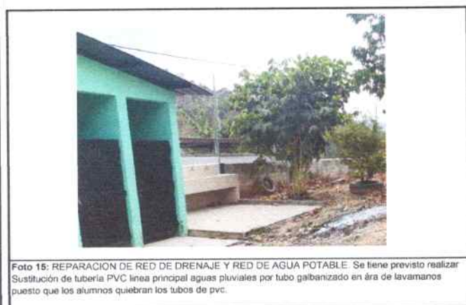
Foto 15: REPARACIÓN DE RED DE DRENAJE Y RED DE AGUA POTABLE. Se tiene previsto realizar Sustitución de tubería PVC línea principal aguas pluviales por tubo galvanizado en área de lavamanos puesto que los alumnos quiebran los tubos de pvc.