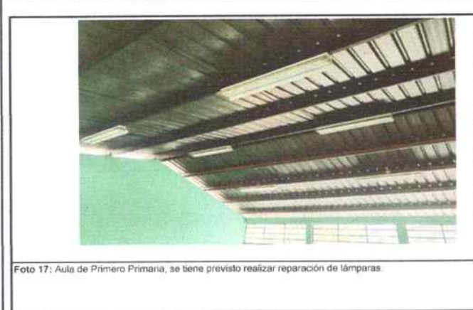
Foto 17: Aula de Primero Primaria, se tiene previsto realizar reparación de lámparas.