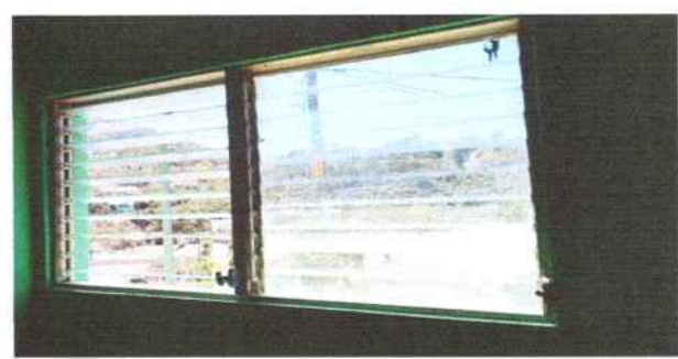
Foto 2: Ventanas de las aulas de segundo y tercero primaria, se tiene previsto hacer mantenimiento a marcos de aluminio mill finish y se colocaran vidrio(paletas).