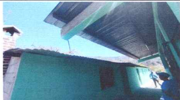
Foto 6: Parte de enfrente del aula de primero primaria, donde se tiene previsto colocar canales y bajadas de agua pluvial.

Observación: Si es necesario se pueden agregar hojas adicionales y actualizar el número de hojas.