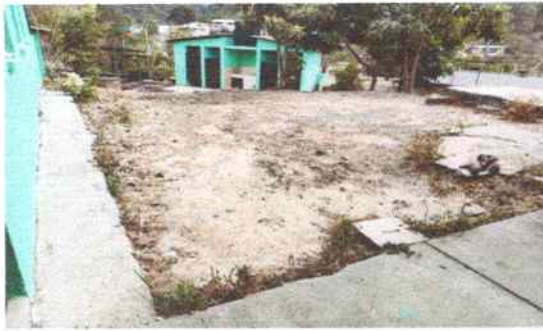
Foto 9: Área recreativa en mal estado, donde se tiene previsto realizar losa de patio, para poder evitar que los alumnos tengan un accidente por caídas y que se quiebren un brazo, pierna o se lastimen una parte del cuerpo.