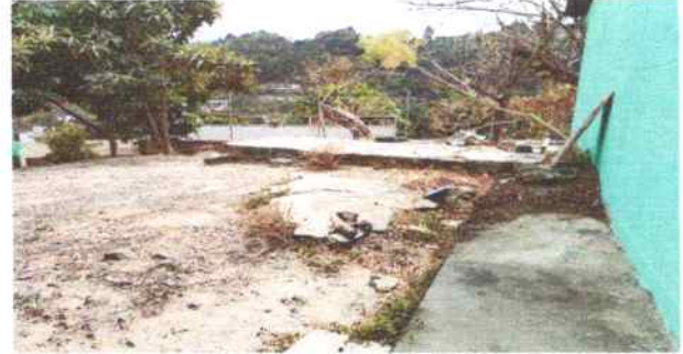
Foto 10: Área recreativa en mal estado, donde se tiene previsto realizar losa de patio, para poder evitar que los alumnos tengan un accidente por caídas y que se quiebren un brazo, pierna o se lastimen una parte del cuerpo.