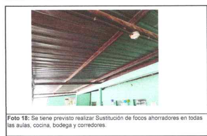
Foto 18: Se tiene previsto realizar Sustitución de focos ahorradores en todas las aulas, cocina, bodega y corredores.

Observación: Si es necesario se pueden agregar hojas adicionales y actualizar el número de hojas.