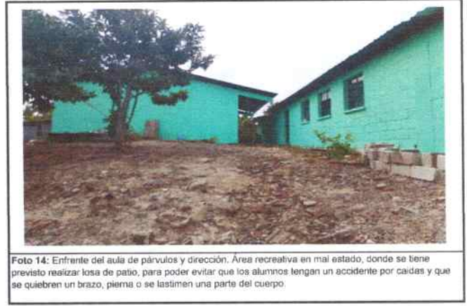
Foto 14: Frente del aula de párvulos y dirección. Área recreativa en mal estado, donde se tiene previsto realizar losa de patio, para poder evitar que los alumnos tengan un accidente por caídas y que se quiebren un brazo, pierna o se lastimen una parte del cuerpo.