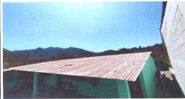
Foto 1: Aulas de Segundo y tercero primaria donde se tiene previsto la sustitución de lámina por lámina troquelada aluzin calibre 26 y mantenimiento de techo.