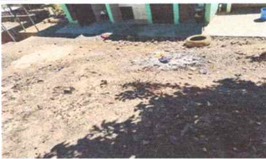
Foto 11: Enfrente de los sanitarios. Área recreativa en mal estado, donde se tiene previsto realizar losa de patio, para poder evitar que los alumnos tengan un accidente por caídas y que se quiebren un brazo, pierna o se lastimen una parte del cuerpo.