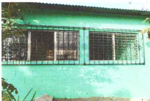
Foto 5: Aula de Segundo y tercero Primaria, parte de atrás donde se realizará mantenimiento de balcones y ventanas.