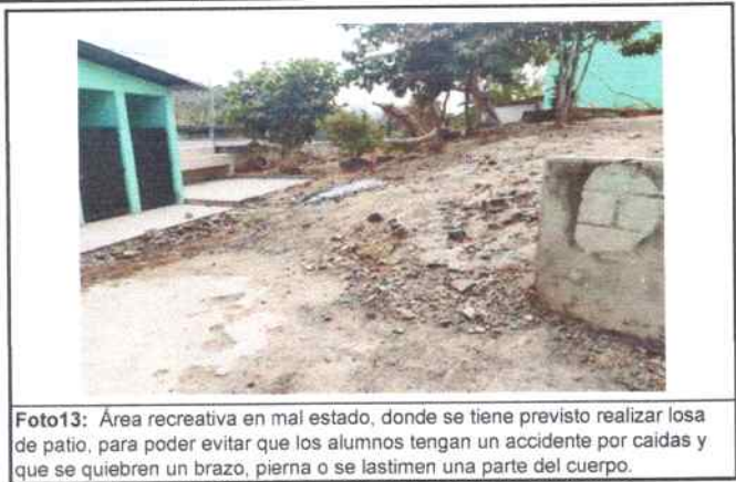
Foto 13: Área recreativa en mal estado, donde se tiene previsto realizar losa de patio, para poder evitar que los alumnos tengan un accidente por caídas y que se quiebren un brazo, pierna o se lastimen una parte del cuerpo.