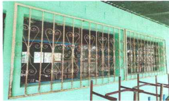
Foto 4: Aulas de segundo y tercero primaria parte de enfrente, se tiene previsto hacer mantenimiento a balcones (pintar).