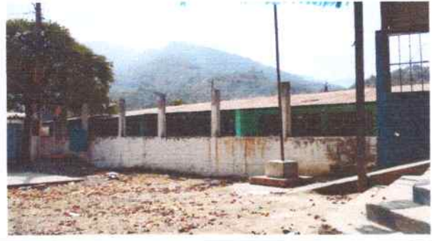
Foto 8: Muro perimetral: donde se tiene previsto la Sustitución de balcones de metal, pintura interior y exterior.