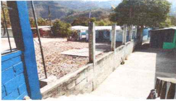
Foto 7: Muro perimetral: donde se tiene previsto la Sustitución de balcones de metal, pintura interior y exterior.