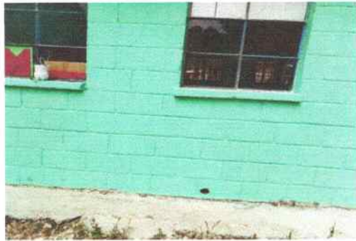
Foto 3: Aula de párvulos donde se tiene previsto la sustitución de vidrios al frente y atrás del aula.