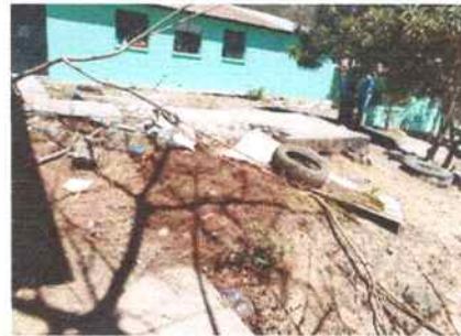
Foto 12: Enfrente del aula de párvulos y dirección. Área recreativa en mal estado, donde se tiene previsto realizar losa de patio, para poder evitar que los alumnos tengan un accidente por caídas y que se quiebren un brazo, pierna o se lastimen una parte del cuerpo.

Observación: Si es necesario se pueden agregar hojas adicionales y actualizar el número de fotos.