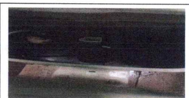
Foto 6: se muestra uno de los depositos de los sanitarios el cual necesita sustitución de accesorios.

Observación: Si es necesario se pueden agregar hojas adicionales y actualizar el número de hojas.