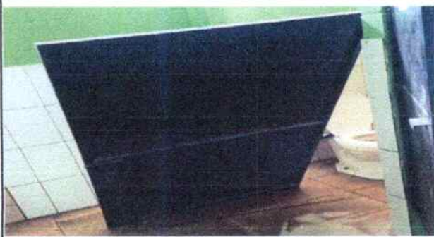
Foto 7 : se muestra la puerta que se debe sustituir en los baños.