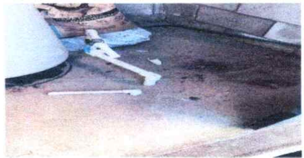
Foto 8: se muestra el lugar en el cual se colocara la nueva bomba de agua.