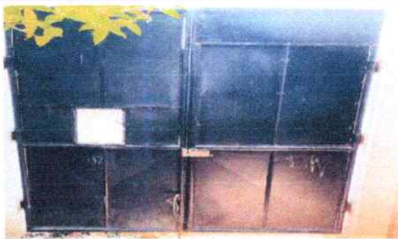
Foto:9 se muestra el porton que se sustituiria debido a que presenta daños en su estructura.