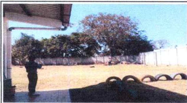
Foto 3; se muestra el muro al cual se le colocara malla y razor. Se muestran padres de familia ayudando a tomar las medidas del muro.