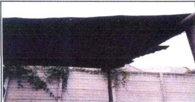
Foto 1 : se muestra fotografía del techado del patio central el cual necesita ser sustituido. Pues sus soportes son de madera y vara de bambú la cual ya esta deriorada.