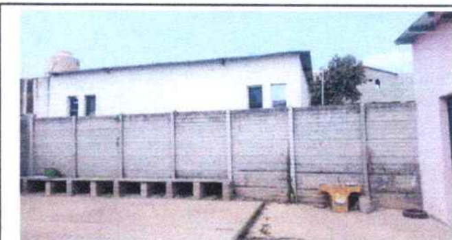
Foto: 4 se muestra otra parte del muro al cual se le colocará malla y tubo galvanizado desde la parte de abajo, para poder ampliar la altura del mismo, para seguridad del establecimiento.