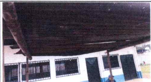
Foto 2: Techado del patio central el cual necesita ser sustituido, pues representa un peligro para los estudiantes.