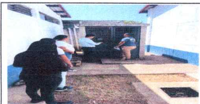
Foto 5: vista de afuera del lugar en el que estaba la bomba , lugar en el cual se colocará una nueva puerta reforzada con reja y chapa. Se muestra a la presidenta de la OPF, técnico , docentes y directora.