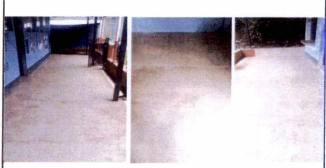
Foto 2: sustitución de torta de concreto por piso de granito en aulas y corredor.