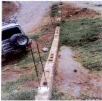
Foto 1: Reparación de muro perimetral, con block y malla. Al costado izquierdo y enfrente de la escuela.