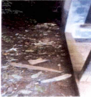
Foto 7: Sustrucción de cuneta, con cuneta de concreto al lado derecho de la escuela