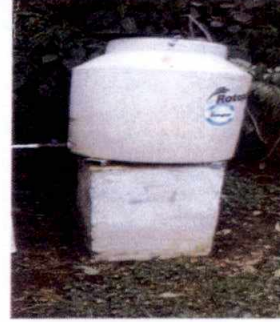
Foto 8: Sustrucción de depósito de agua de baño de los niños y niñas por uno mas grande.