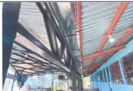
FOTO 12: MANTENIMIENTO A ESTRUCTURA DE SOPORTE DE METAL Y APLICACIÓN DE PINTURA EN MUROS EXTERIORES