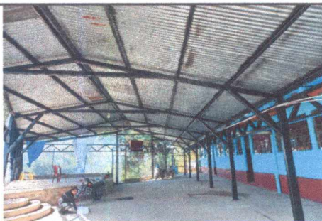
FOTO 11: MANTENIMIENTO A ESTRUCTURA DE SOPORTE DE METAL Y APLICACIÓN DE PINTURA EN MUROS EXTERIORES