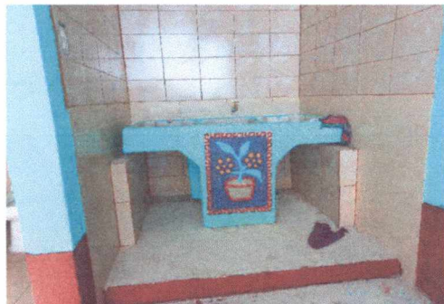
FOTO 8: SUSTITUCIÓN DE PILA POR PILA DE CONCRETO DE 2 LAVADEROS, SUSTITUCIÓN DE TUBERÍA DE AGUA POTABLE Y CHORRO