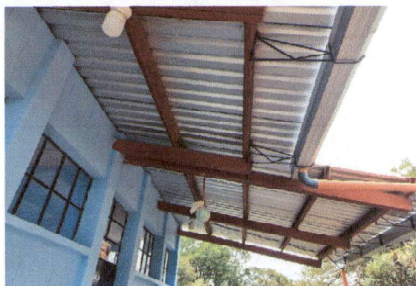
FOTO 1: SUSTITUCIÓN DE LÁMINA POR LÁMINA TROQUELADA ALUZINC CALIBRE 26 EN DOS AULAS Y DIRECCIÓN