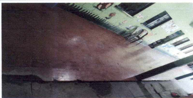
Sustrucción de piso de cemento por piso cerámico