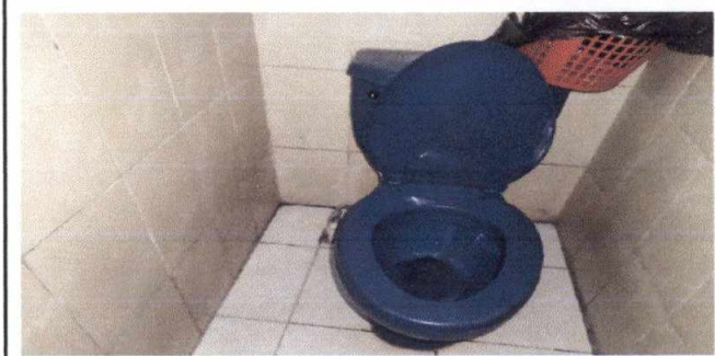
sustrucción de inodoros malos

Observación: Si es necesario se pueden agregar hojas adicionales y actualizar el número de hojas.